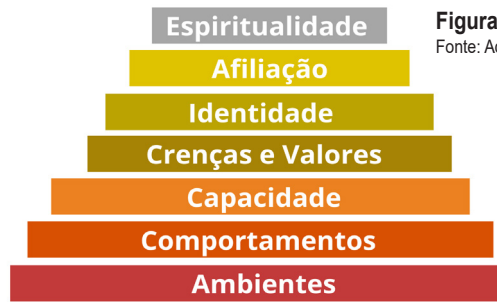
Figura 4. Pirâmide de Maslow.

Na versão apresentada a partir dos estudos de José Roberto Marques, são abordados os sete níveis da evolução do ser humano no seu processo evolutivo, como na Figura 4, sintetizando os processos que podem ser trabalhados para melhoria e um possível caminho, sendo o significado de cada nível de 1 a 7: