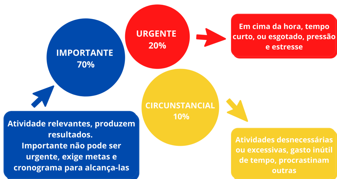
Figura 2. Tríade do Tempo, distribuição ótima

Como tarefa, verifique seu planejamento a curto, médio e longo prazo; claro que você tem um, certo? Verifique o que pode ser delegado e/ou redistribuído. Faça planos semanais, de modo que as tarefas possam ser reajustadas na semana e sem perder o foco nos deadlines preestabelecidos.