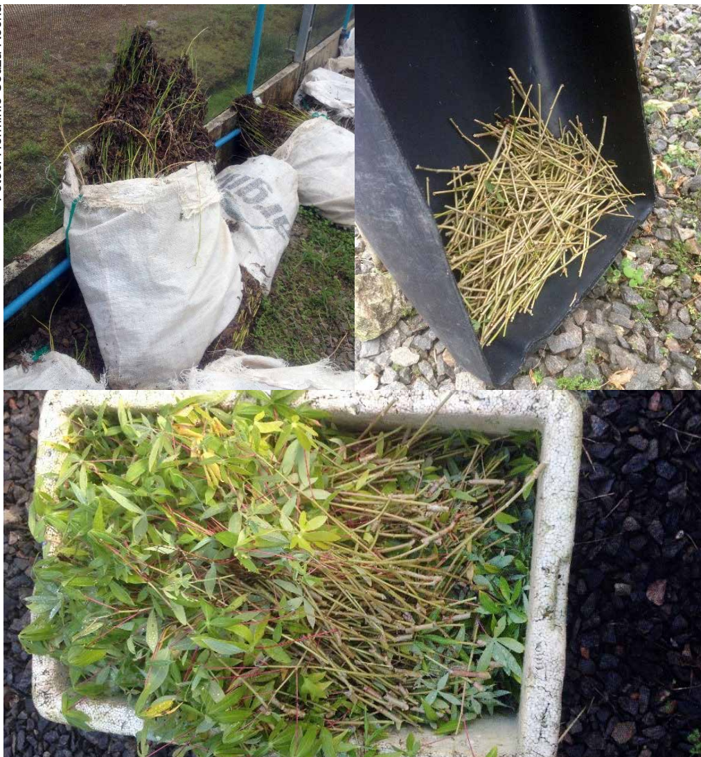
Figura 4. Resultado das podas das mudas estioladas. Grande volume de hastes finas contendo gemas de brotações, com potencial de geração de novas plantas.