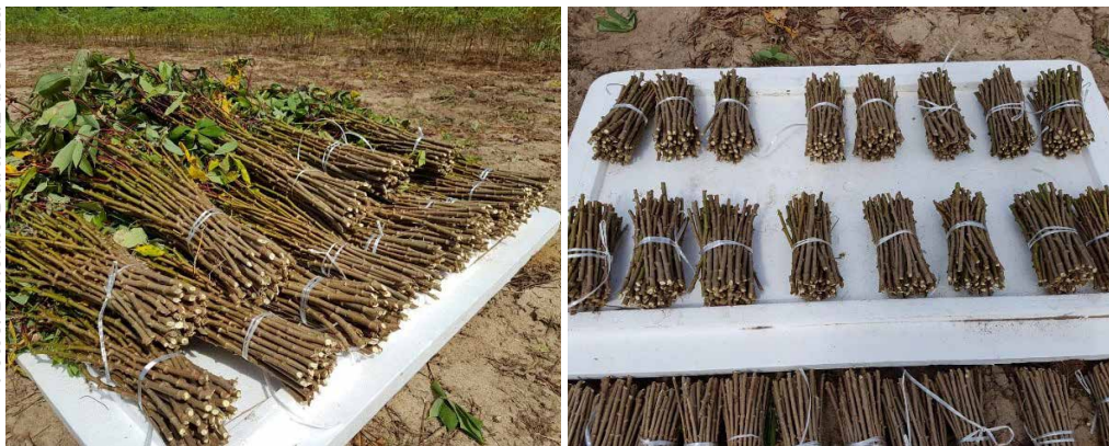
Figura 13. Colheita de miniestacas de mandioca ‘BRS Poti’ colhidas a partir de plantas com 9 meses de plantio.