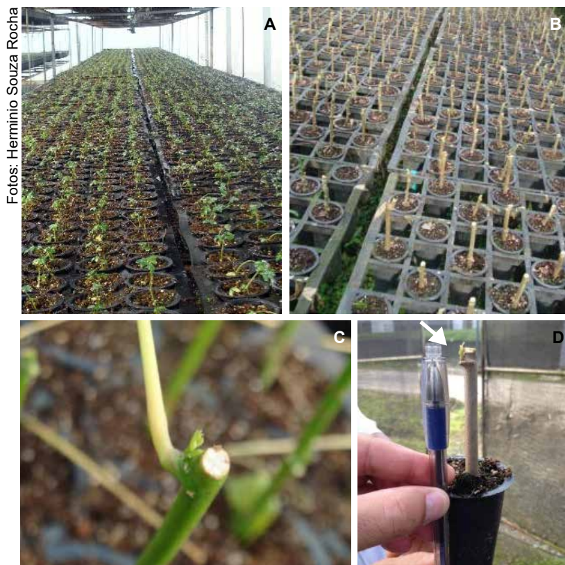
Figura 1. Etapas da fase inicial do processo de produção de miniestacas de mandioca a partir de mudas micropropagadas em aclimatização, que compreende: mudas micropropagadas em aclimatização (A); mudas podadas para formação de nova parte aérea (B); corte reto na haste para induzir nova brotação (C); muda podada com nova brotação já visível (seta) (D).

de aproximadamente 1,0 m – 1,3 m. No caso das mudas micropropagadas, as mudas são deliberadamente deixadas na fase de aclimatização por um tempo maior que o habitual de 60 dias, para que haja o estiolamento da parte aérea até atingirem cerca de 50 cm – 80 cm. As miniestacas são coletadas das bases das hastes cortadas aproximadamente a 5 cm – 7 cm a partir do colo da muda (Figura 1 D).