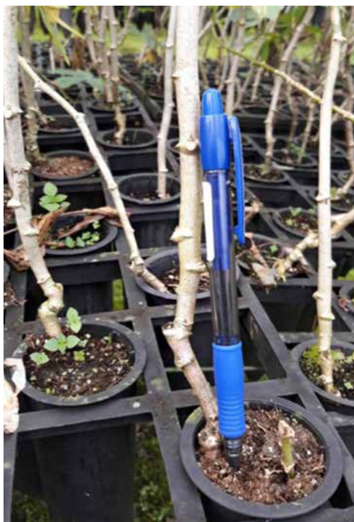
Figura 7. Espessura ideal dos talos das mudas de mandioca aclimatizadas para extração de miniestacas.