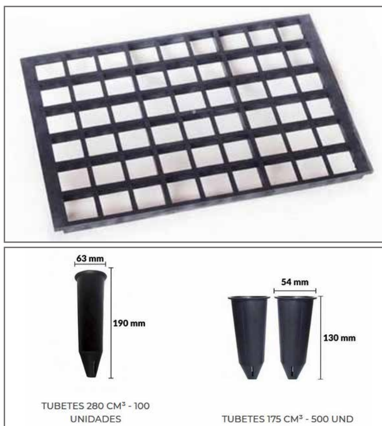
Figura 5. Bandeja e tubetes plásticos utilizados no plantio de mudas de mandioca para produção de miniestacas como material propagativo.

Para os tipos de tubetes recomendados existem as bandejas de sustentação que apresentam 54 células cada.