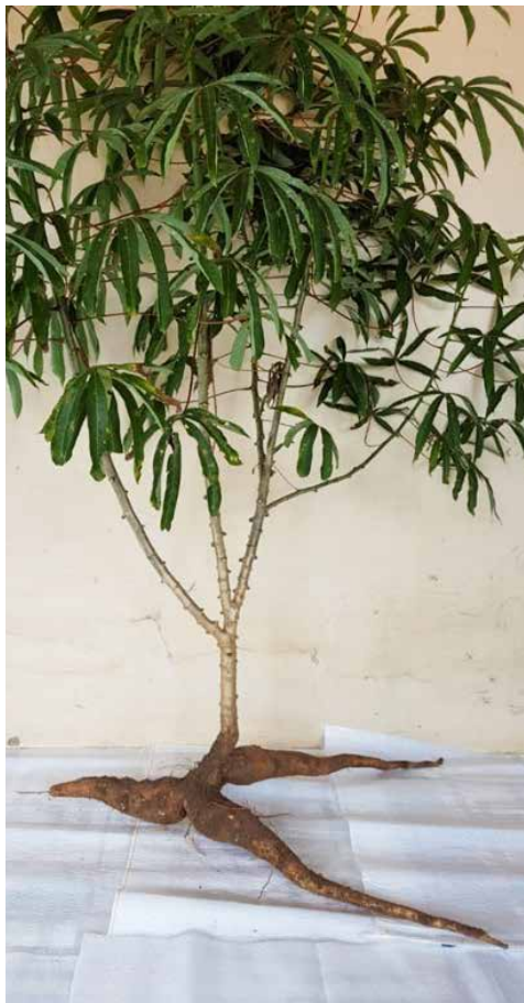
Figura 15. Planta de mandioca ‘BRS Formosa’ com seis meses de idade, produzindo 2,7 kg de raízes.