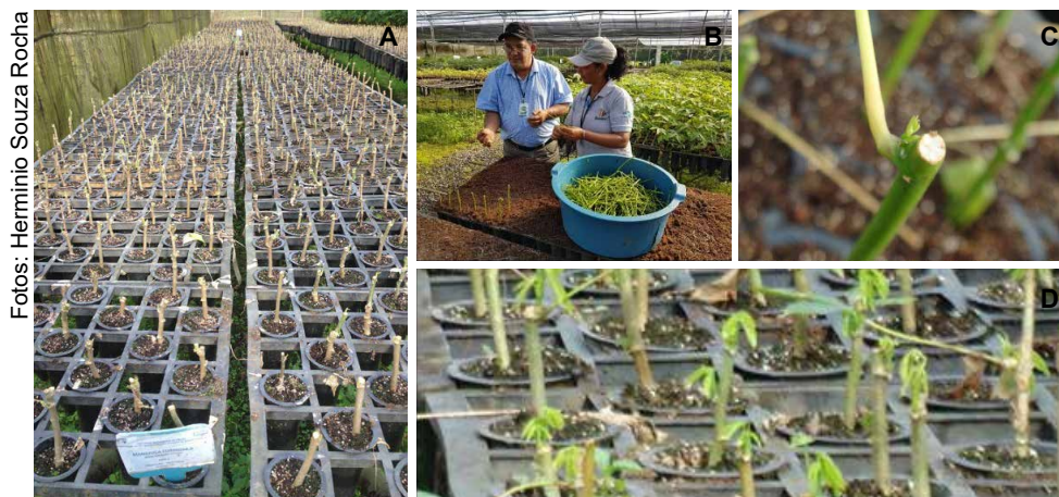
Figura 9. Poda drástica de hastes em mudas em aclimatização (A); plantio das porções superiores da haste para produção de novas mudas (B); brotação das porções de hastes replantadas demonstrando o adequado desenvolvimento (C); formação de novas mudas de mandioca em tubetes, em telados, com o mesmo substrato usado inicialmente para a formação das mudas iniciais (D).