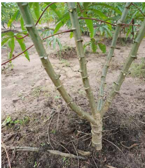
Figura 14. Plantas de mandioca ‘BRS Formosa’, produzidas a partir de miniestacas, em Tracuateua – PA, na primeira avaliação aos quatro meses após plantio.