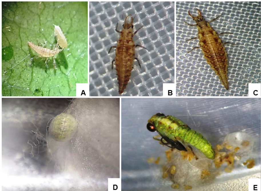
Figura 1. Fases do desenvolvimento de Chrysoperla externa . Larvas de primeiro (A), segundo (B) e terceiro (C) instares, pré-pupa (D) e adulto recém-emergido (E).