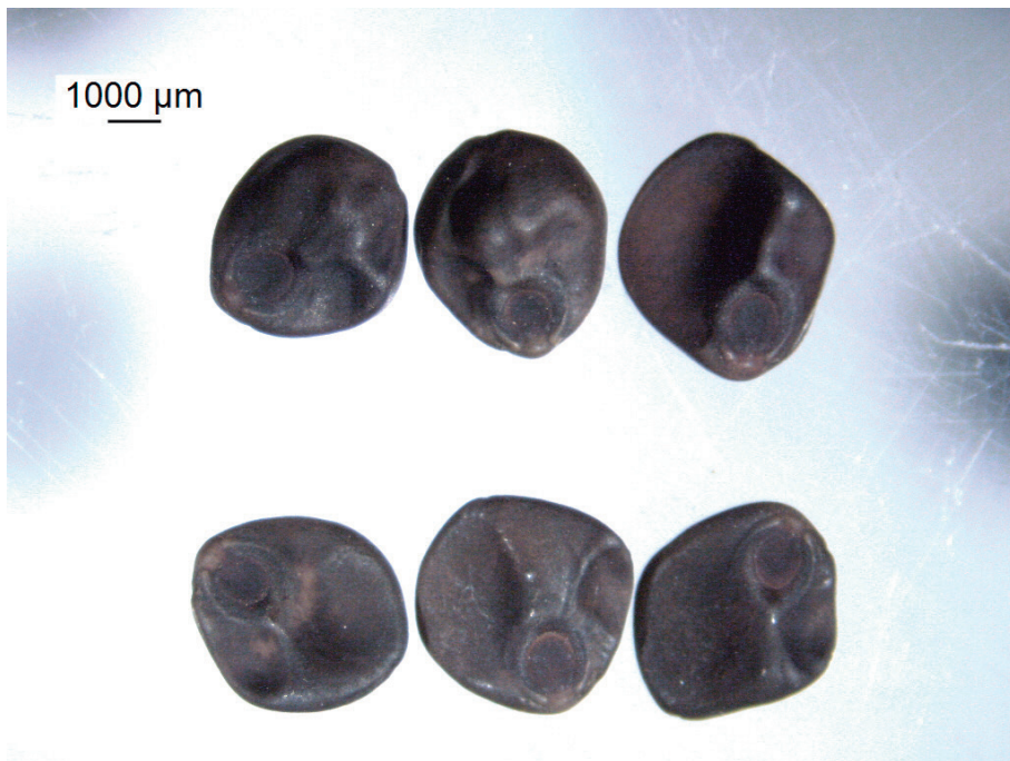
Figura 1. Sementes botânicas de batata-doce.

manual geralmente contém duas sementes (Huamán, 1992). Um método eficaz para separar sementes cheias – mais densas – de outras com algum tipo de anormalidade ou injúrias, e que as tornam menos densas, é o teste de flutuação. Esse teste tem como princípio separar sementes que submergem, apresentando endosperma e embrião normais, de outras que flutuam, consideradas sementes vazias (BRASIL, 2009). As que submergem apresentam maior índice de velocidade e taxa de germinação, e as que ficam na superfície podem ser consideradas pouco viáveis (Rós et al., 2018). O embrião e o endosperma são protegidos por uma testa espessa, dura e impermeável, dificultando a germinação, havendo necessidade de tratamento químico ou escarificação (Huamán, 1992). Existem vários métodos que melhoram o percentual de germinação do lote de sementes. O mais comumente utilizado é a escarificação química com ácido sulfúrico, onde as sementes são imersas em solução com concentração acima de 90% (Huamán e Asmat, 2019), durante 40 minutos. As sementes são enxaguadas para que se elimine qualquer resquício do ácido (Wilson et al., 1989 apud Lebot, 2009). Por esse