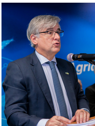
Ignacio Ybáñez Embaixador da União Europeia no Brasil