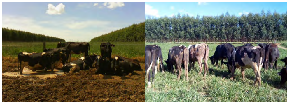
Figura 6. Novilhas leiteiras em ócio e pastejo em sistemas pastoril sem árvores no Brasil Central.