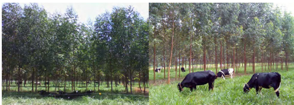
Figura 5. Novilhas leiteiras em ócio e pastejando em sistemas silvipastoris no Brasil Central.