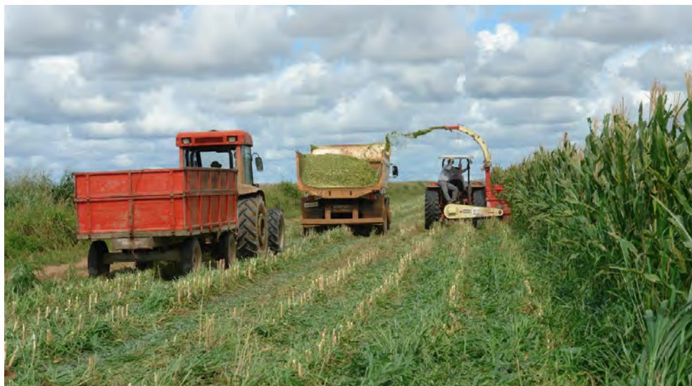
Figura 2. Colheita de milho consorciado com braquiária para produção de silagem.

O milho quando cultivado nas entrelinhas de eucaliptos, em associação inicial, apresentou maiores produtividades de grãos que em monocultivo, seu cultivo não influenciou na sobrevivência da espécie florestal e ainda promoveu a redução de 50,8% no custo da implantação da espécie florestal (Moniz, 1987). Desta mesma forma, Silva et al. (2015), que trabalharam com o milho consorciado com U. ruziziensis em três sistemas de cultivo, observaram que a produtividade de grãos de milho aumentou no Sistema Santa Fé e no Sistema de ILPF intercalado com mogno africano, quando comparados com o Sistema Convencional.