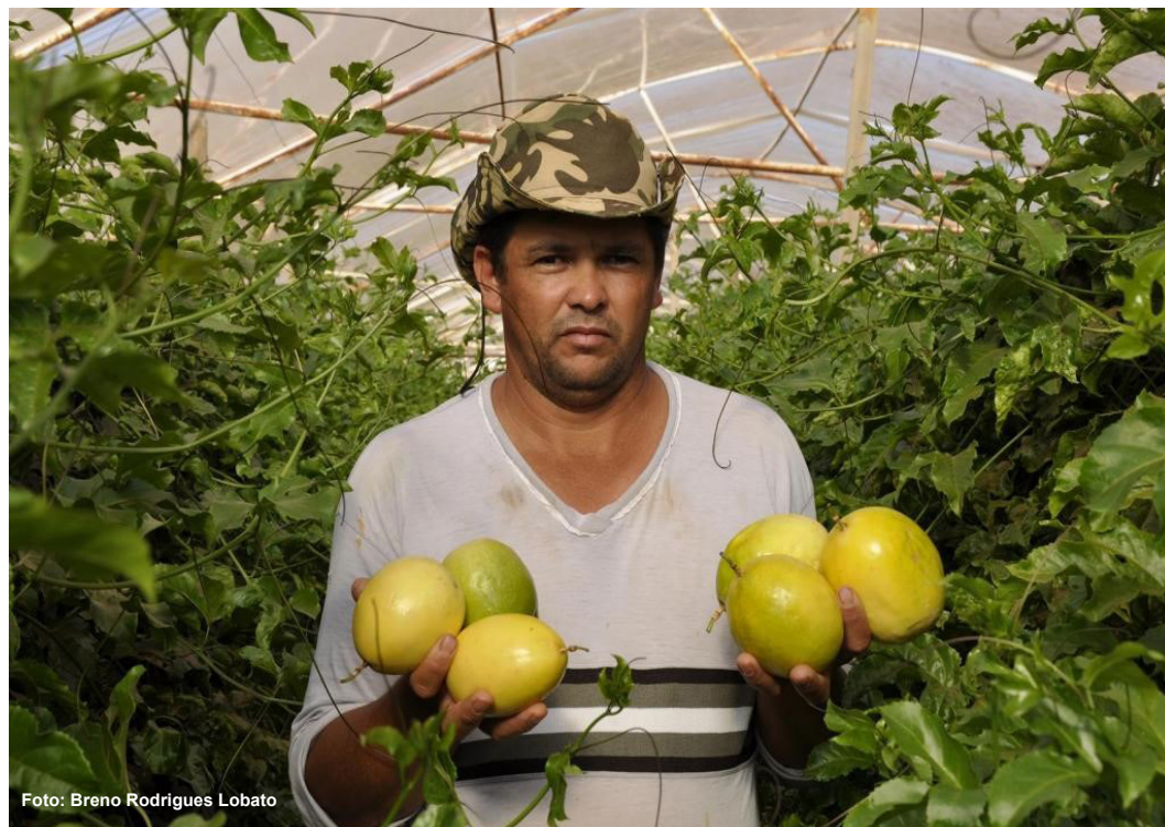
Figura 1. Plantio de maracujazeiro-azedo em estufa.