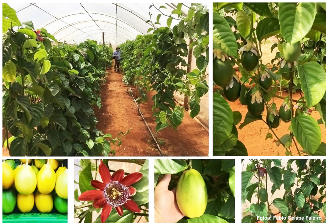
Figura 7. Cultivo do maracujazeiro-doce em estufa, em Brazlândia, Distrito Federal.

Utilizando alta tecnologia no sistema de produção, o fruticultor tem obtido alta produtividade e frutos com alta qualidade física e química. Os frutos, quando maduros, têm coloração de casca amarela, massa variando de 120 a 300 gramas (média de 200 g), com polpa amarelo alaranjada e teor de sólidos solúveis muito alto (acima de 17° Brix).