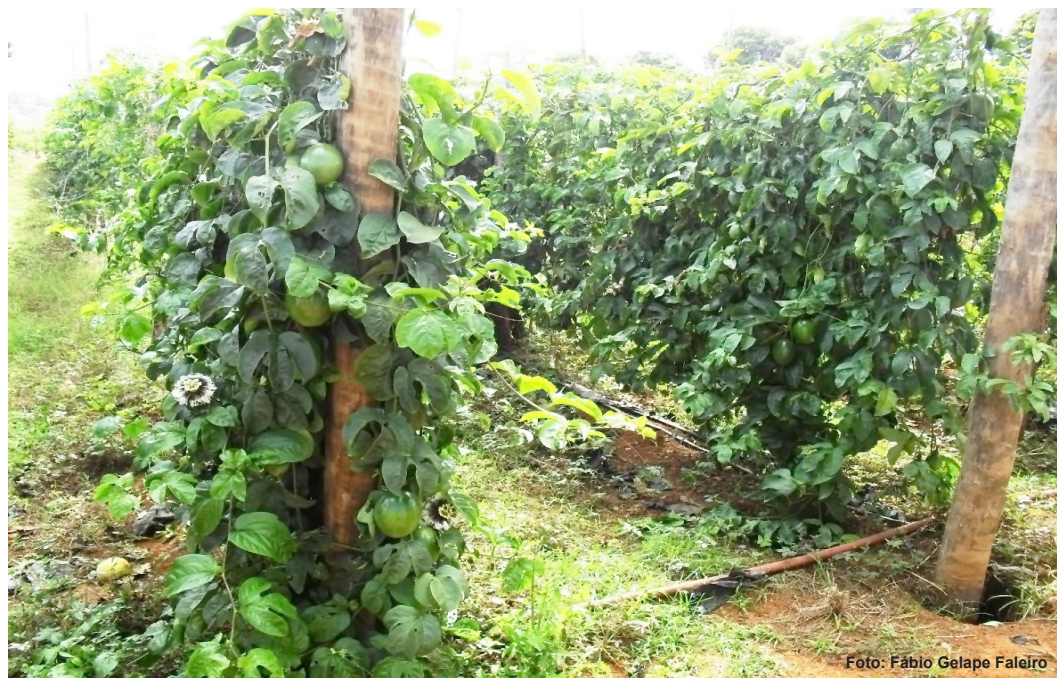
Figura 5. Pomar de maracujá com espaçamento de 1,8 m entre linhas e 1,5 m entre plantas.

polinização manual devido à proximidade de diferentes plantas, alta produtividade no primeiro ano de produção e otimização do uso de pequenas áreas, típicas dos micro e pequenos produtores (Figura 5).