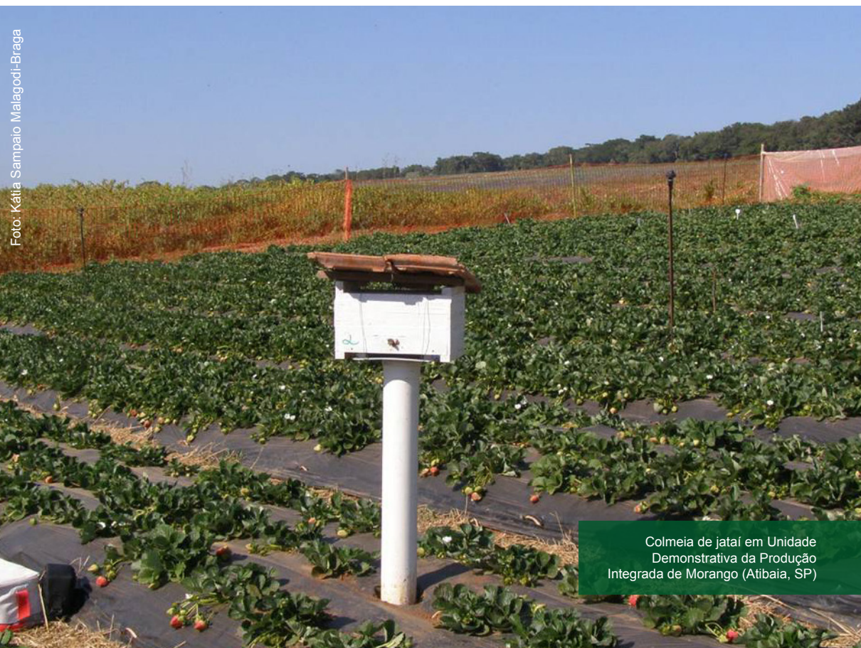
Colmeia de jataí em Unidade Demonstrativa da Produção Integrada de Morango (Atibaia, SP)