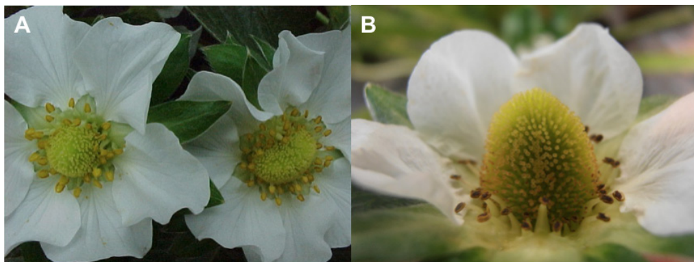
Figura 4. Flores do morangueiro: (A) receptáculos florais (miolos das flores) com diferentes tamanhos e formatos; (B) flor primária da cultivar San Andreas com o receptáculo bem mais alto que as anteras (escurecidas) gerando uma separação espacial bastante acentuada entre as anteras e a ponta do receptáculo.

Quanto maior for a separação temporal e espacial entre as anteras e os estigmas de uma cultivar, maior será a sua dependência da polinização por abelhas para uma produção comercial adequada. As flores primárias da cv. SC, por exemplo, possuem anteras mais próximas aos pistilos que a cv. OG (Figura 5), porém seus pistilos superiores amadurecem somente no 5º dia após a abertura da flor, demandando uma maior oferta de polinizadores que a cv. OG onde isto ocorre no 3º dia.