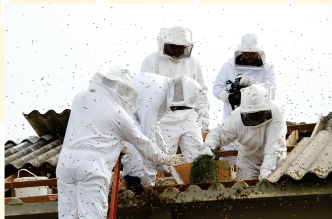
Abertura do local de entrada do enxame para acesso aos favos.