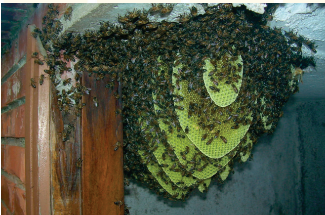
Enxame de abelhas melíferas alojado em uma casa, necessitando de remoção por uma Brigada Apícola.

Enxames de abelhas melíferas alojados em praças ou prédios geralmente estão em locais de difícil acesso, colocando em risco a população, vulneráveis aos inimigos naturais e em condições inadequadas para manejos produtivos pelos apicultores.