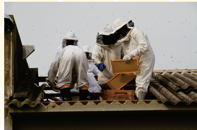
Lâminas de cera alveolada aceleram o trabalho de construção dos favos pelo enxame.