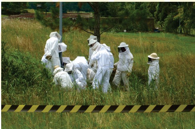
Remoção de enxame mal alojado feita por equipe de uma Brigada Apícola.

As Brigadas Apícolas municipais são grupos organizados de apicultores/as e membros da comunidade que respondem pela remoção de enxames de abelhas melíferas africanizadas de forma coordenada, eficiente e segura para a população e operadores.