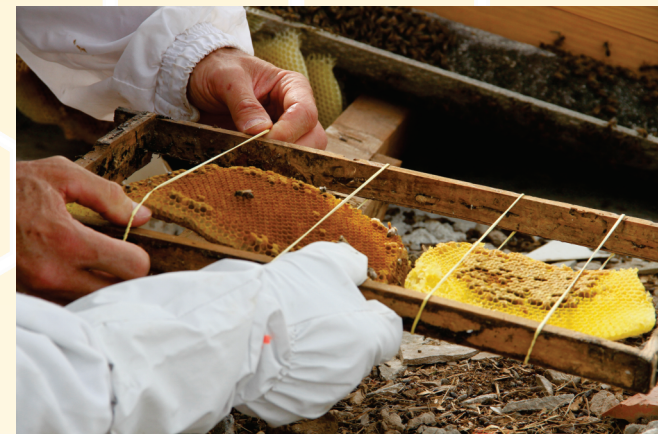
Corte dos favos de cria e fixação no caixilho utilizando atilho de borracha.