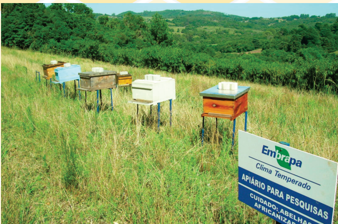
Colméias em produção no apiário

f) Transportar a colméia 3 a 7 dias após a remoção, à noite e com o máximo de suavidade e rapidez, e instalar em um apiário na zona rural.