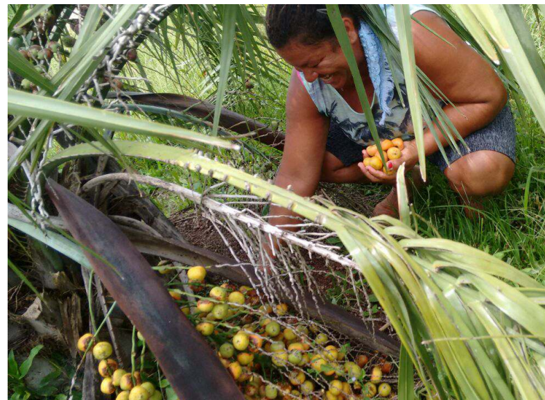
Butiás em Canguçu (RS, Brasil).