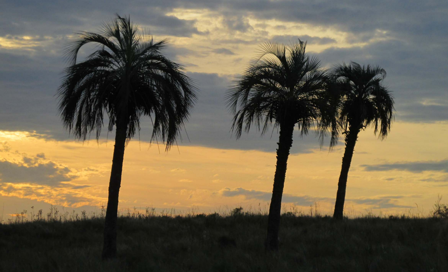
Butiazal em Quaraí (RS, Brasil).

Os butiazais estão desaparecendo da paisagem devido à ação do homem. Uma solução para que essas plantas não sejam extintas é o incentivo ao uso na alimentação, no artesanato e no paisagismo, de maneira sustentável.