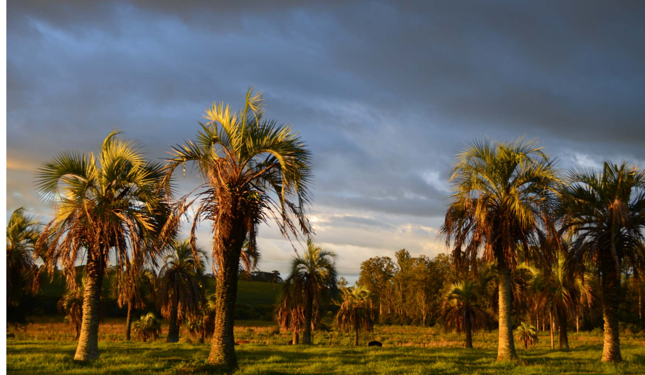
Butiazal em Giruá (RS, Brasil).