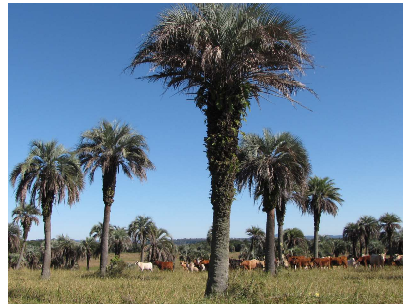
Butiazal em Tapes (RS, Brasil).

A Rota dos Butiazais é um espaço de integração que une Brasil, Uruguai e Argentina, promovendo a conservação ambiental e o uso sustentável da biodiversidade associada aos butiazais. É uma conexão de pessoas, locais e ideias num amplo território onde existe uma ligação cultural importante com o butiá.