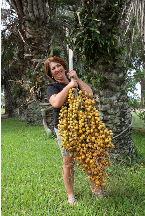
Cacho de butiá em Santa Vitória do Palmar (RS, Brasil).