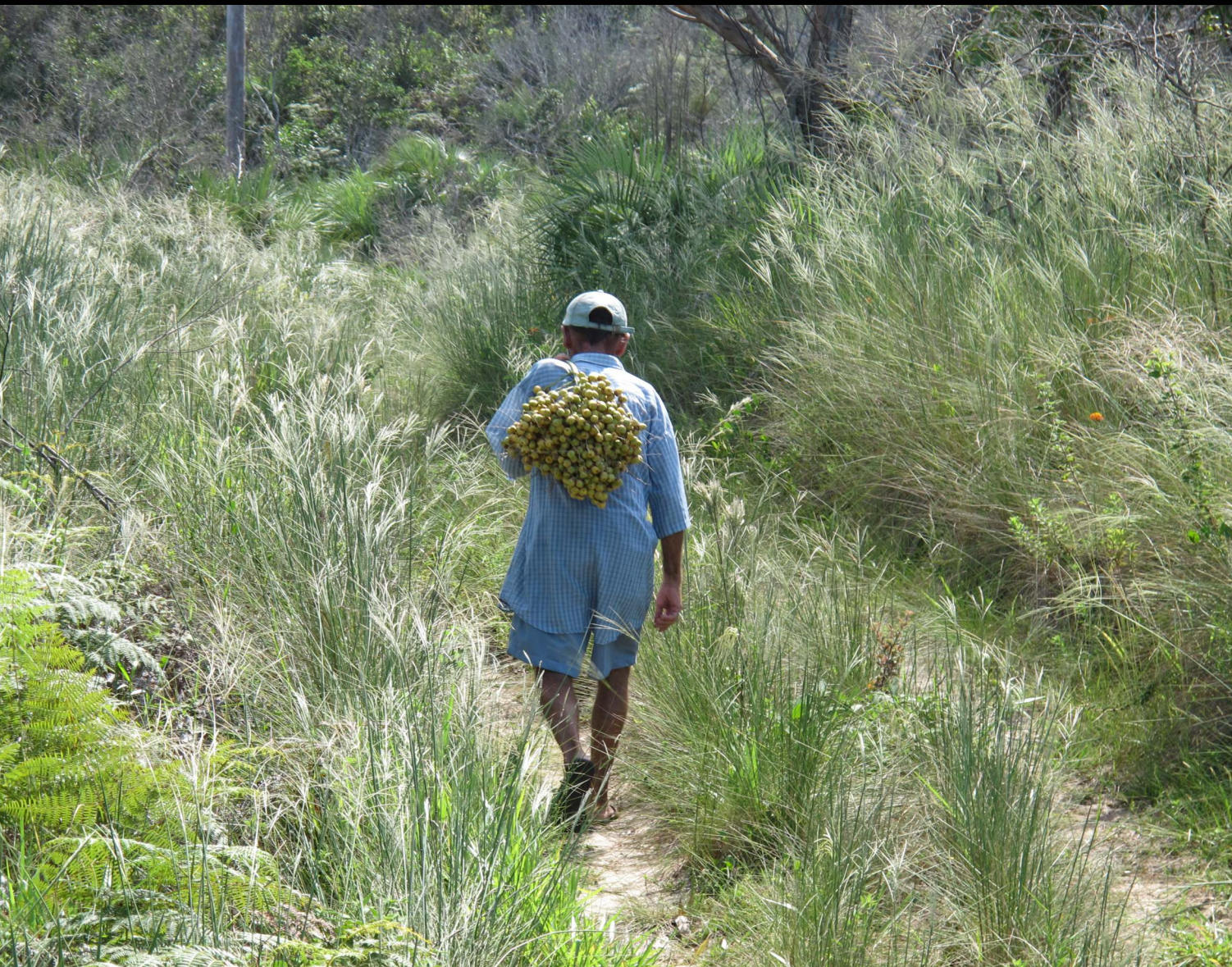
Capa - Butiazal em Tapes (RS, Brasil).