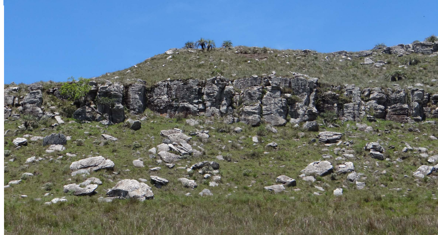
Butiazal no Cerro Miriñaque, em Rivera (Uruguai).

Lugares que forman parte de la Red Palmar, donde se han realizado actividades diversas, como seminarios, conferencias, talleres de cocina y artesanía, exposiciones, exhibición de vídeos y distribución de material didáctico.