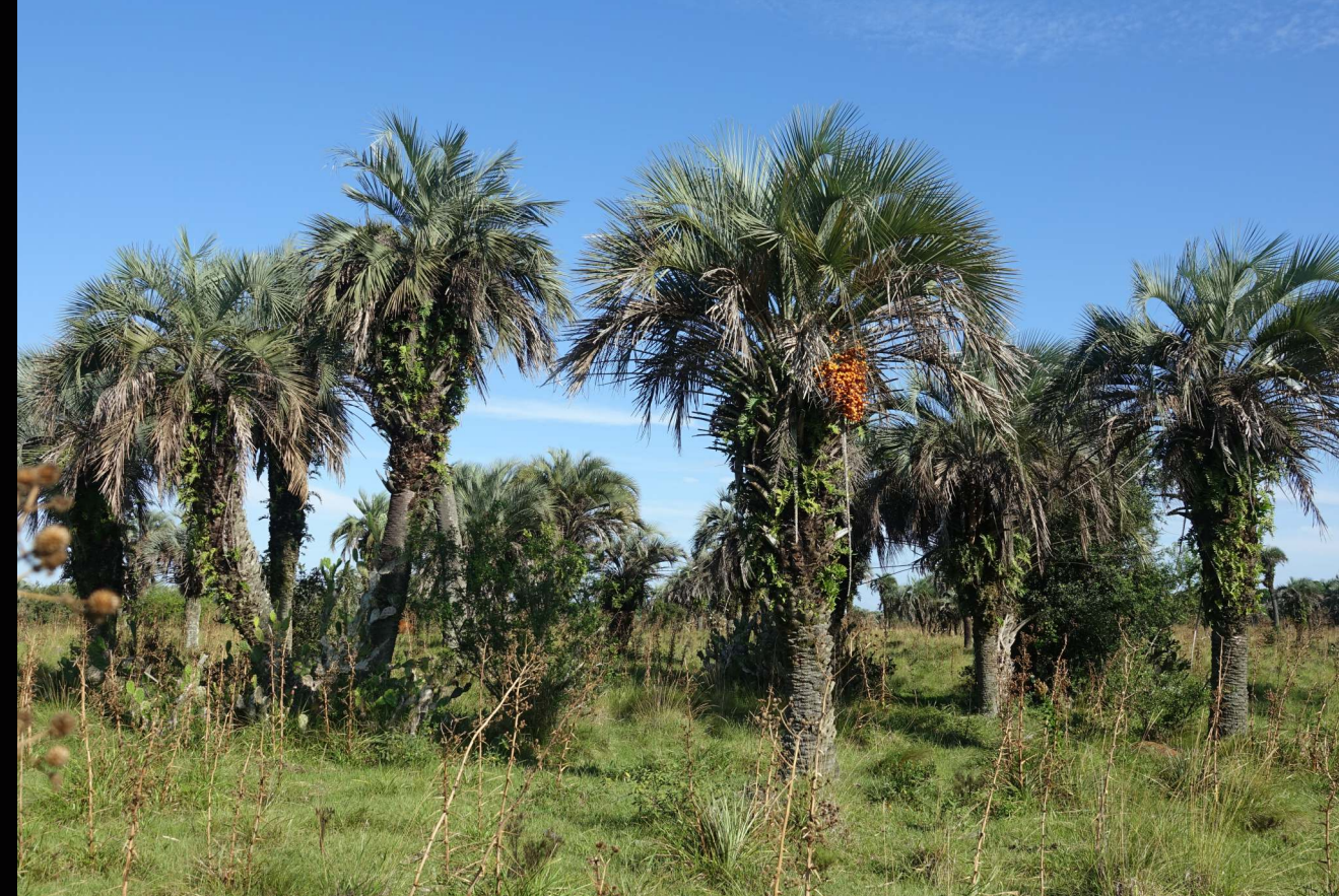
Campo nativo no butiazal em Tapes (RS, Brasil).

Os butiás são plantas da família das palmeiras. São conhecidas 20 espécies nativas do Brasil, Uruguai, Argentina e Paraguai, as quais podem ser encontradas nos Biomas Pampa, Mata Atlântica e Cerrado.