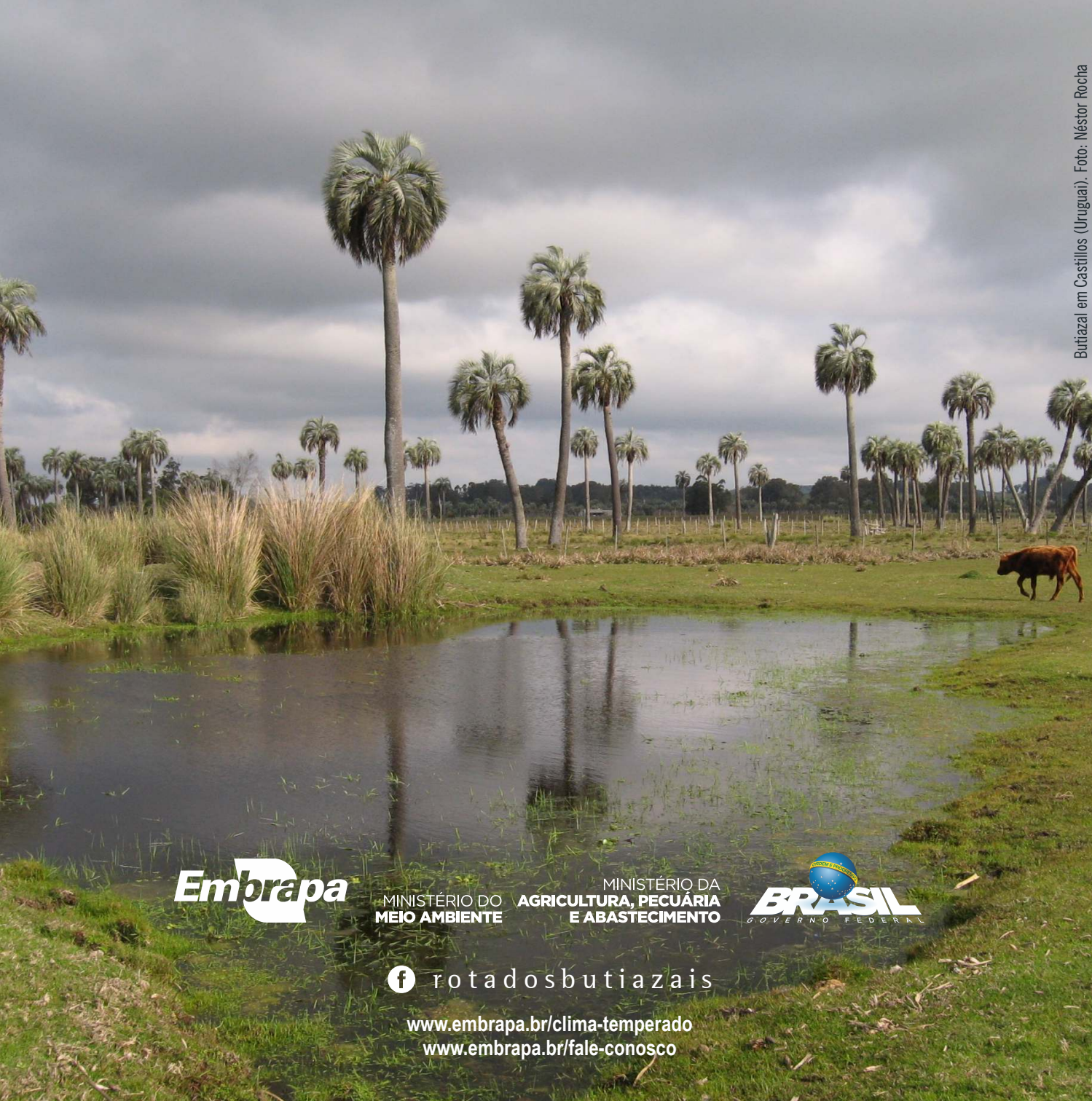
Butiazal em Castillos (Uruguai).