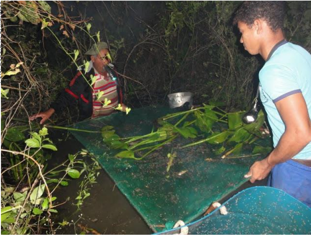
Figura 2. Modo de pesca de tuyras.

Apesar das dificuldades enfrentadas, nas conversas durante as pescarias que acompanhamos, sempre esteve presente a afirmação da decisão de permanecer na localidade onde mora e de incentivar as novas gerações para a continuidade da atividade pesqueira e do modo de vida ribeirinho. O limite para essa decisão está nos obstáculos enfrentados pelas comunidades quanto ao território, no caso da comunidade da Barra do São Lourenço, nos baixos preços alcançados no comércio de peixes e nas regras de exploração dos recursos naturais impostas pela legislação. É muito clara, portanto, a necessidade de abordagens multidisciplinares para avaliações das características relacionadas à pesca profissional, em janelas que abranjam os recursos necessários, os recursos resultantes e as externalidades dos processos, para fornecer bases para a formulação de políticas públicas robustas para o alcance do desenvolvimento sustentável.