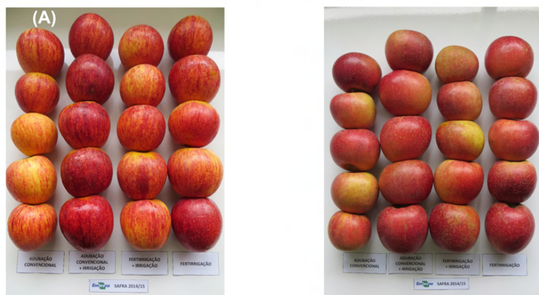
Figura 1. Amostras de frutos de macieira cv. Maxigala (A) e Fuji Suprema (B), retratando o efeito dos tratamentos de irrigação e fertirrigação. Safra 2014/15.

Para as condições brasileiras, os primeiros resultados de pesquisa com irrigação na cultura da macieira mostraram que a irrigação e a fertirrigação, quando da ocorrência de déficit hídrico no solo, afetam positivamente a produção, aumentando a produção de frutas de maior calibre, e a qualidade da fruta, incrementando a coloração da película da fruta (Figura 1).