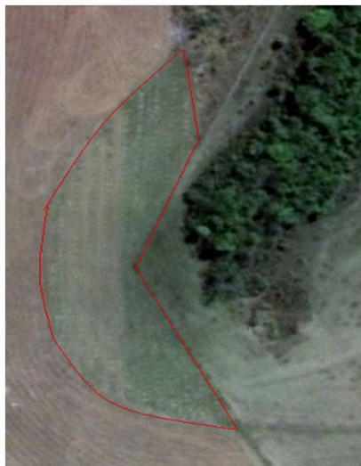
Figura 1. Imagem aérea do local de instalação da UR com seus limites demarcados pela linha em vermelho, circundando parcialmente a área de manancial.

Além dessa estrutura, está implantada no local uma área com coleção de cultivares de café para avaliação de desempenho agrônômico e outra destinada ao plantio de tefrósia ( Tefrosia cândida ), planta utilizada na fabricação de um formicida natural em desenvolvimento pela Cooperativa. A delimitação da área de instalação da UR pode ser verificada na Figura 1.