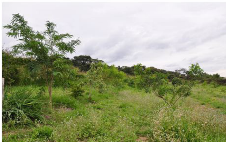
Figura 23 (20/06/2012)

Figuras 19, 20, 21, 22 e 23. Presença de outras espécies de plantas espontâneas que surgiram no sistema a partir do manejo de controle da braquiária.