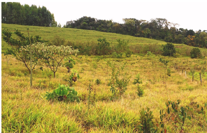
Figura 24. Imagem parcial da área indicando algumas das espécies de árvores que tiveram maior desenvolvimento se destacando na paisagem, em especial nas linhas superiores (20/06/2012).

Para acompanhar o desenvolvimento temporal da área foram realizadas medições da altura e diâmetro de todos os indivíduos (Figuras 24 e 25). Essa avaliação permitiu observar o desenvolvimento diferenciado de algumas espécies em relação às demais, com destaque para as espécies pioneiras, tais como: capixingui, aroeira, embaúba, guapuruvu, sangra-d'água, angico e ingazeiro. Também foi possível verificar nitidamente o início da estratificação entre as plantas inseridas no sistema (Figuras 26 e 27).