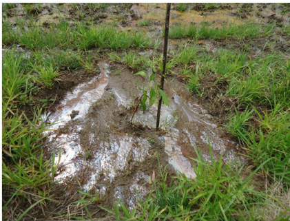
Figura 28 (23/03/2011)

Levando-se em consideração a avaliação de 24 meses do sistema, o índice de mortalidade das mudas foi de 25%, porcentagem dentro dos padrões encontrados na literatura (OLIVEIRA, 2009), incluindo-se as mudas mortas pela inundação e parte da área. No segundo ano de implantação do sistema, no período das chuvas verificou-se que a parte mais baixa da área e mais próxima do manancial ficou “encharcada” durante boa parte do período das águas, o que posteriormente ocasionou mortalidade considerável das mudas dessa área. (Figuras 28 e 29). Nessa área o índice de mortalidade chegou próximo de 100%, o que levou a uma reconfiguração das espécies que foram ali instaladas. A adoção de espécies adaptadas a regiões de alagamento possibilitou o uso de áreas que não eram aproveitadas no plantio comum, aumentando a diversidade de espécies e racionalizando o uso do solo.