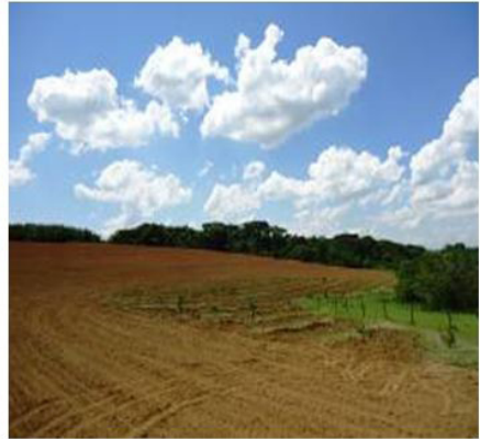
Figuras 16 (28/10/2011)