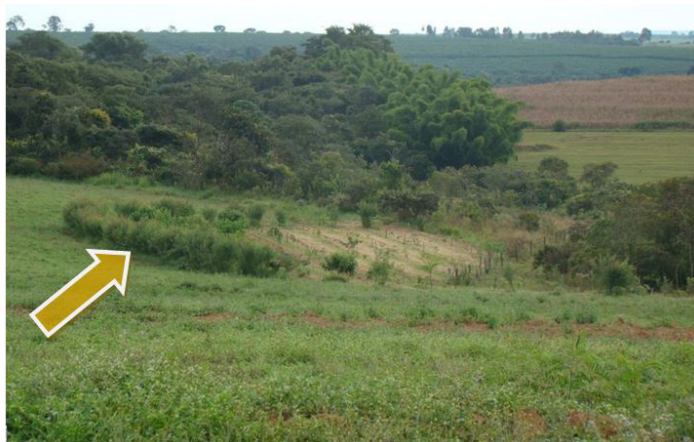
Figura 14. Outra visão da cerca viva implantada no sistema (26/04/2012).