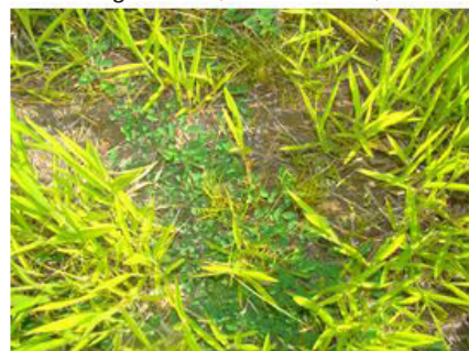
Figura 22 (06/12/2012)