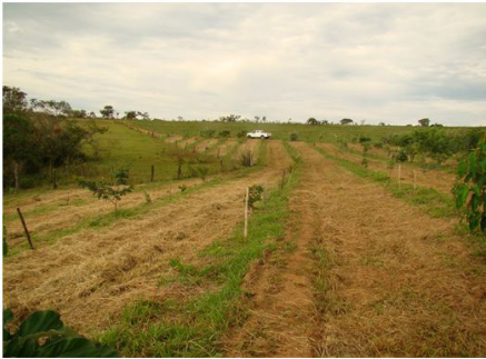
Figura 9 (26/04/2012)

Esse conjunto de estratégias ao longo do período inicial de desenvolvimento do sistema é fundamental para que se promova um ambiente favorável ao estabelecimento das árvores, minimizando o risco de perda de mudas pela competição negativa com as gramíneas. A mortalidade de mudas em percentual acima do recomendado também pode gerar a formação de áreas contínuas sem a presença do estrato arbóreo, que permitem o pleno desenvolvimento da gramínea.