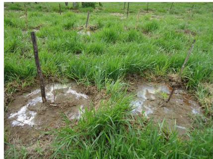
Figura 29 (23/03/2011)

Figuras 28 e 29. Acentuado alagamento de parte da área e que ocasionou intensa mortalidade das mudas implantadas nessa parte do terreno (23/03/2011).