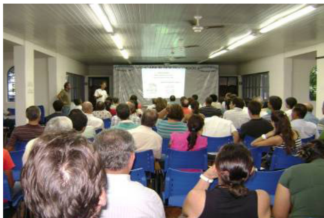
Figura 4. Seminário sobre recuperação de áreas degradadas realizado (07/02/2011).

Além de serem abordadas questões conceituais ligadas ao tema, foram disponibilizadas a um público mais amplo as metodologias participativas de construção da proposta e do planejamento específico dessa UR e de sua implantação na área, que iria ocorrer no dia seguinte.