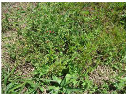
Figura 20 (08/03/2012)