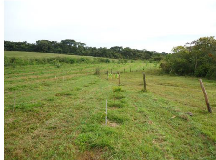
Figura 10 (24/05/2012)

Figuras 9 e 10. Confecção de coroas nas mudas e o manejo de roçagem da braquiária.