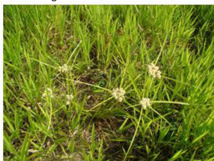
Figura 21 (06/12/2012)