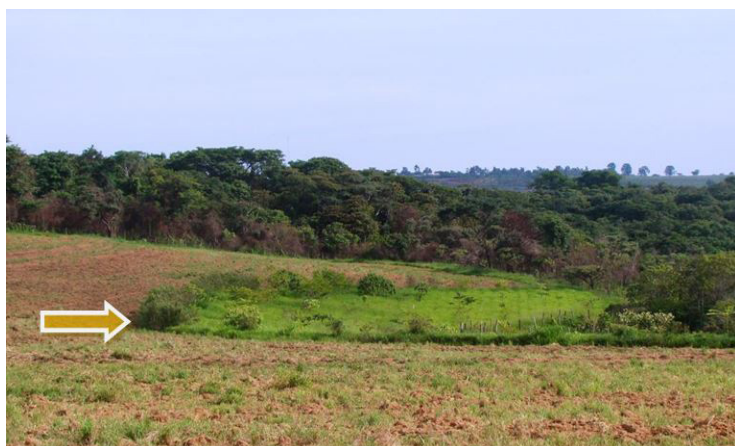
Figura 13. Cerca-viva já estabelecida na parte superior da UR (06/12/2012).

Figuras 11 e 12. Gradagem das entrelinhas para plantio de adubos verdes e deposição nas linhas das árvores da matéria seca oriunda da roçagem da braquiária.