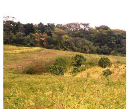
Figuras 18 (20/06/2012)

Figuras 15, 16, 17 e 18. Alterações na fisionomia da paisagem ao longo do desenvolvimento do sistema.