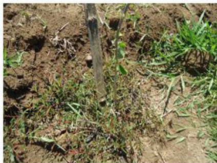
Figura 19 (26/10/2011)