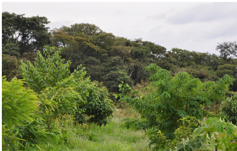
Figura 25. Imagem parcial da área com destaque para o bom desenvolvimento de algumas das espécies (20/06/2012).