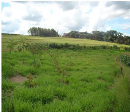
Figuras 17 (06/12/2012)