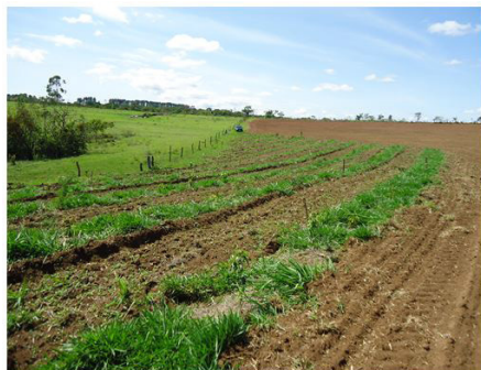
Figura 11 (26/10/2011)