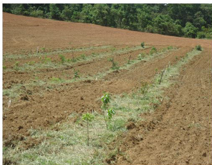
Figura 12 (28/10/2011)

Figuras 11 e 12. Gradagem das entrelinhas para plantio de adubos verdes e deposição nas linhas das árvores da matéria seca oriunda da roçagem da braquiária.