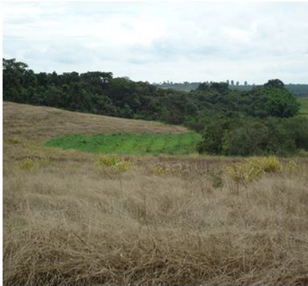
Figuras 15 (23/03/2011)