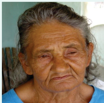
Fazendo Barbosa Povoado Salgado do Melão Macururé – BA

Para comunicar à Embrapa a ocorrência do algodão nativo em sua propriedade, entre em contato através do telefone (83) 3182-4300 ou do site www.embrapa.br/fale-conosco/sac