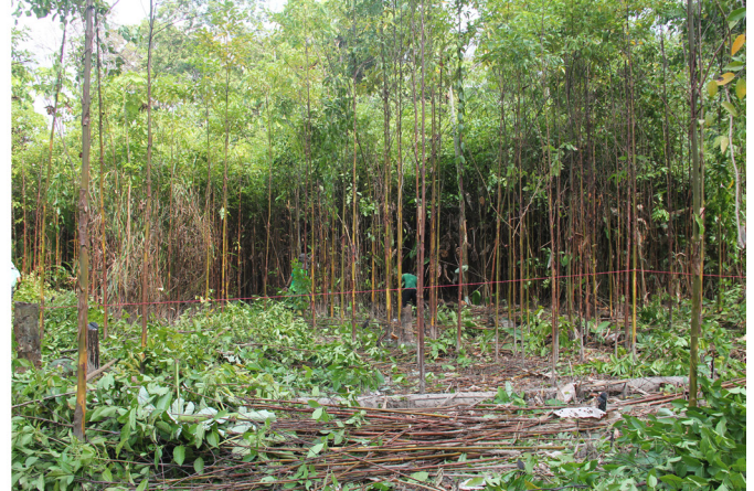
Figura 2. Primeiro desbaste de regenerantes de pau-mulato em área de várzea do estuário do Rio Amazonas.

na base do solo (DAS) de 0,51 cm. Isso facilita o arranque e, conseqüentemente, evita a rebrota, que poderá ocorrer se as plântulas forem eliminadas por corte, pelo processo de roçagem. Deve-se evitar arrancar as mudas no período do verão amazônico (de setembro a novembro), quando a água das marés não adentra nas áreas mais elevadas de várzea e o solo siltoso fica muito seco e duro.