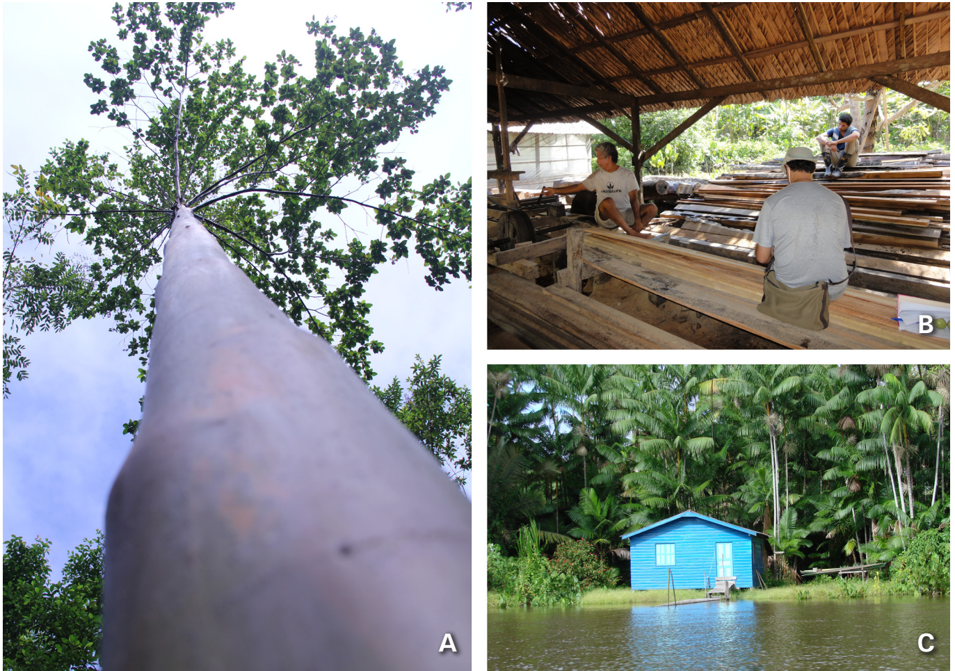
Figura 6. Árvore de pau-mulato apta para produção de madeira serrada (A); madeira serrada de pau-mulato processada em micro serraria familiar da área de várzea (B) e típica casa de família ribeirinha que utiliza o pau-mulato em sua construção (C).