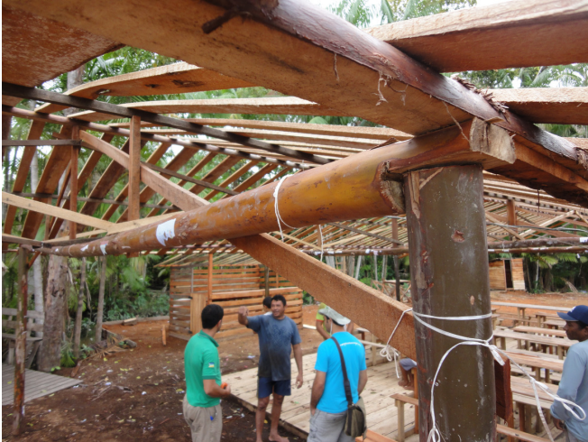
Figura 5. Construção rústica confeccionada por agroextrativista que mora na beira de rio do Município de Gurupá, PA, utilizando madeira roliça de pau-mulato.