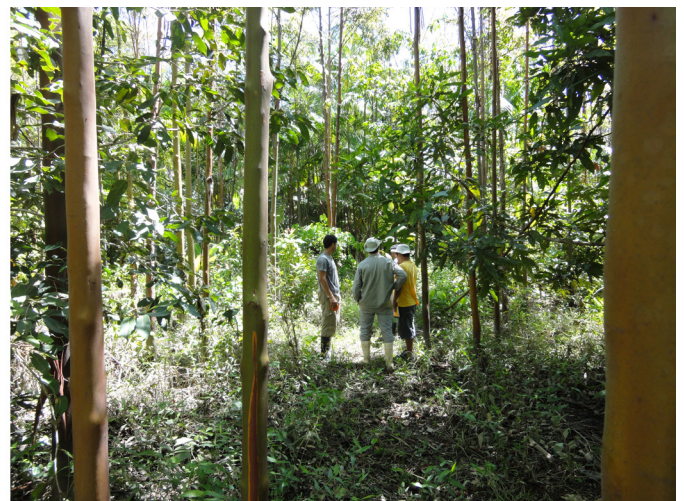
Figura 4. Áreas com regeneração natural de pau-mulato no Município de Mazagão, AP e idade entre 5 e 7 anos, aptas para realização do segundo desbaste e produção de madeira roliça.