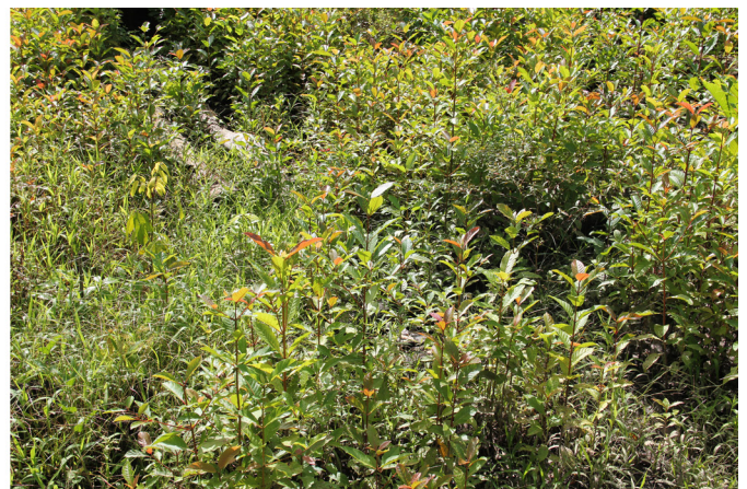
Figura 1. Potencial de regeneração natural de pau-mulato em área de agricultura itinerante preparada com uso do fogo, 6 meses após abandono do roçado, em área de floresta de várzea no Município de Mazagão, AP.