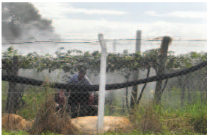
Figura 1. Pulverização realizada de forma inadequada em parreiras de uva

De certa forma, há dificuldades intrínsecas da condução da cultura para o tratamento fitossanitário. A condução comercial da cultura a campo considera a prática da poda drástica uma vez por ano, o que implica numa abrupta redução da massa foliar a praticamente zero, com conseqüente redução da superfície a cobrir. Entretanto, nas diversas regiões de cultivo, poderá haver necessidade de pulverizações nessa condição.