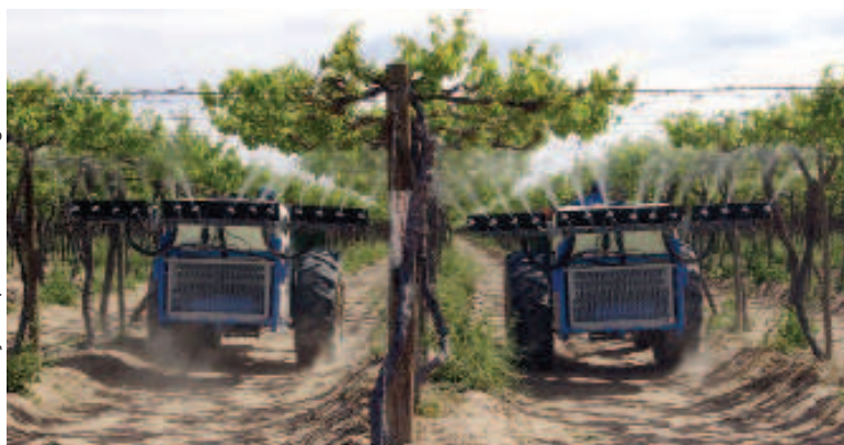
Figura 4. Aspecto de pulverizador eletrostático para a cultura da uva.