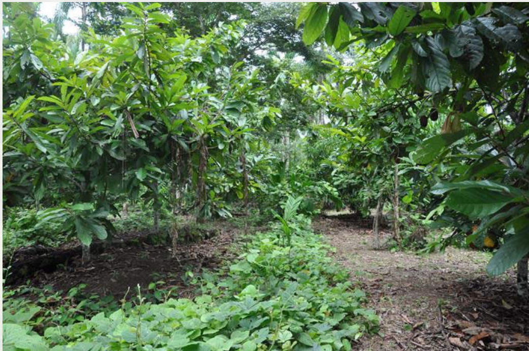
Figura 2. Visão geral do interior do SAF.