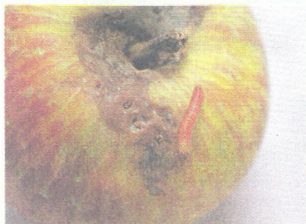
Figura 2. Lagarta de grafolita em quinto instar

As lagartas passam por cinco instares. Do nascimento até o terceiro instar são branco-acizentadas com cabeça preta e com o passar do tempo (4º e 5º instar) adquirem coloração branco-rosada com cabeça marrom, momento em que atingem de 12 a 14 mm de comprimento (Figura 2). Essa fase dura cerca de 14 dias a 25 °C. Próximo do período pupal (período de metamorfose), onde as lagartas se transformam em mariposas, essas deslocam-se dos locais de alimentação para locais protegidos, onde constroem a câmara pupal. Em pomar de maçã, essas câmaras são construídas entre as folhas, nos frutos, nos Burrknots, nas fendas formadas do tronco ou no próprio solo. Nessa fase, o inseto é facilmente disseminado para outros pomares, principalmente quando se encontra próximo à base do pedúnculo dos frutos ou em caixas de transporte (Bins), onde dificilmente é