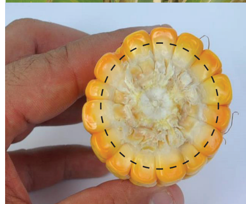
Figura 1. Ponto de colheita do milho.