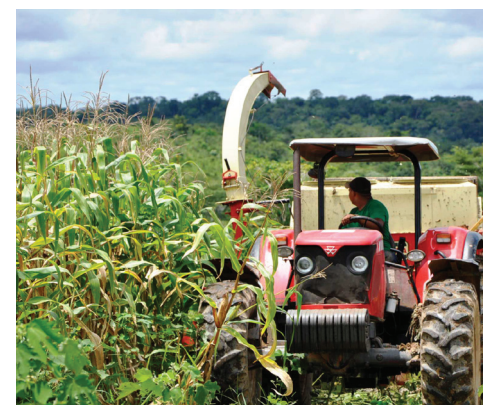
Figura 2. Colheita mecanizada do milho.