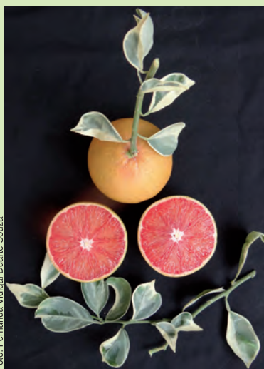
Figura 1. Frutos da laranja "Rubra Cara" ( Citrus sinensis ) com polpa vermelha conferida pela presença de licopeno.