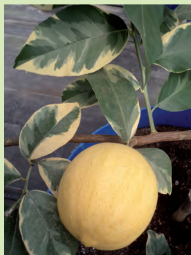
Figura 2. Folhas variegadas em limão 'Variegado' ( C. limon ), característica que lhe confere potencial ornamental.

A citricultura está entre as práticas agrícolas mais antigas da humanidade, sendo a maioria de suas espécies oriunda do continente asiático. Os estudos com citros na Embrapa Mandioca e Fruticultura (Centro Nacional de Pesquisa de Mandioca e Fruticultura Tropical - CNPMF), sediada no Município de Cruz das Almas, Estado da Bahia, 12° latitude sul, remontam ao início dos anos 1950, no então Instituto Agrônômico do Leste – IAL.