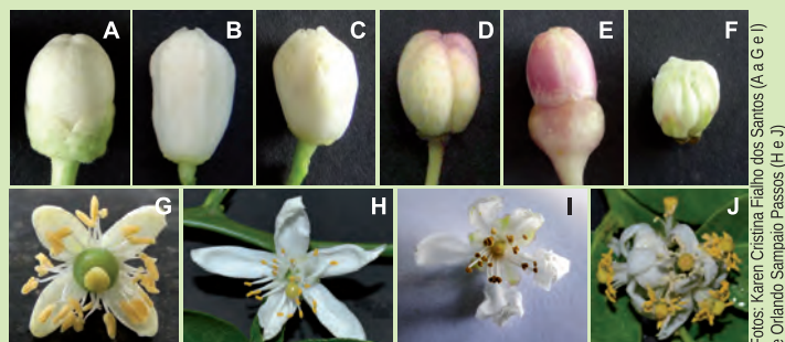
Figura 3. Biodiversidade das espécies presentes no Banco Ativo de Germoplasma de Citros da Embrapa Mandioca e Fruticultura, relativamente a características de flores.

Visando evitar o risco da erosão genética, torna-se necessário o estabelecimento de estratégias efetivas à conservação ex situ dos recursos genéticos disponíveis, buscando-se resgatá-los e preservá-los, de modo a abranger a maior variabilidade genética possível, também viabilizando seu acesso a programas de melhoramento genético, otimizando sua exploração e seu conhecimento, a exemplo da identificação de fontes de genes de valor adaptativo, particularmente a ambientes sujeitos a estresses causados por agentes bióticos (pragas) e abióticos (relacionados ao clima e solo). Nesse sentido, a introdução (via coleta e intercâmbio), a conservação, a caracterização, a avaliação, a documentação e o intercâmbio do germoplasma de citros são atividades fundamentais à exploração agrônômica desse importante grupo de plantas, razão da implantação do Banco Ativo de Germoplasma de Citros da Embrapa Mandioca e Fruticultura – BAG Citros. As Figuras 3 e 4 ilustram a biodiversidade das espécies de Citrus e de gêneros afins, mediante a apresentação, respectivamente, de botões florais e flores, e de frutos, com características botânicas e morfológicas distintas.