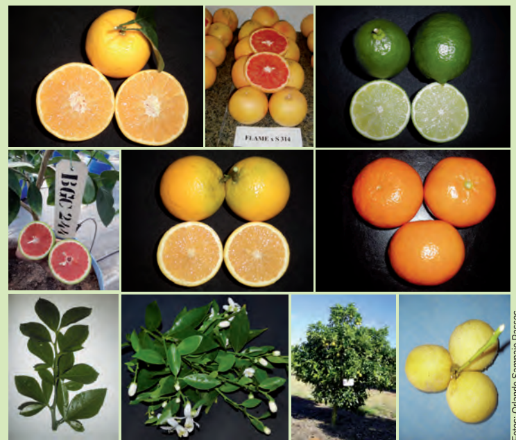
Figura 6. Acessos do BAG Citros da Embrapa Mandioca e Fruticultura descritos em relação a caracteres vegetativos, da inflorescência e do fruto.