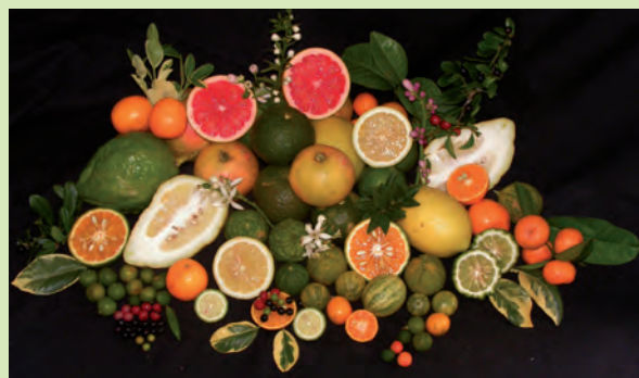
Figura 4. Biodiversidade das espécies do Banco Ativo de Germoplasma de Citros da Embrapa Mandioca e Fruticultura, relativamente a características de frutos.