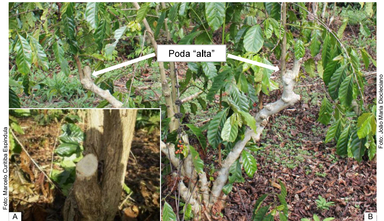
Figura 12. Eliminação de ramo improdutivo a altura de 25 cm do solo por meio da poda de produção tradicional (A). Poda “alta” efetuada incorretamente à altura de 1,0 m ou mais do solo (B).

Por ocasião da desbrota, após a eliminação das hastes improdutivas, deve-se deixar um broto por haste podada, selecionando o mais vigoroso, implantado na parte externa do tronco remanescente. Caso não se tenha brotos adequados, selecionam-se brotos em posição mais adequada na próxima desbrota (Figura 12A). Recomenda-se efetuar a poda cerca de 20 cm a 30 cm do solo evitando-se a “poda alta” (Figura 12B).