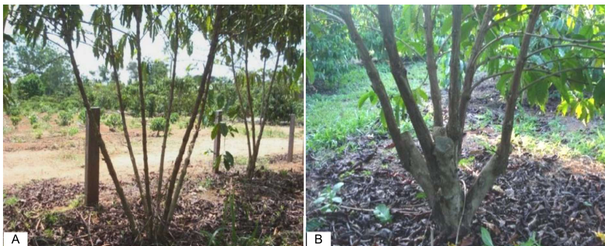
Figura 7. Plantas com seis hastes ortotrópicas bem distribuídas. Selecionadas adequadamente durante a formação da planta (A). Selecionadas adequadamente após a poda de produção (B).

O uso de seis hastes deve ser realizado com cautela para evitar o fechamento do interior das plantas. Para isso, deve-se induzir a emissão de hastes ortotrópicas no início do desenvolvimento das plantas e selecionar os brotos de maneira que as hastes não se concentrem no interior das plantas. Da mesma forma, na poda de produção, os brotos devem ser selecionados visando à formação de copa arejada (Figura 7).