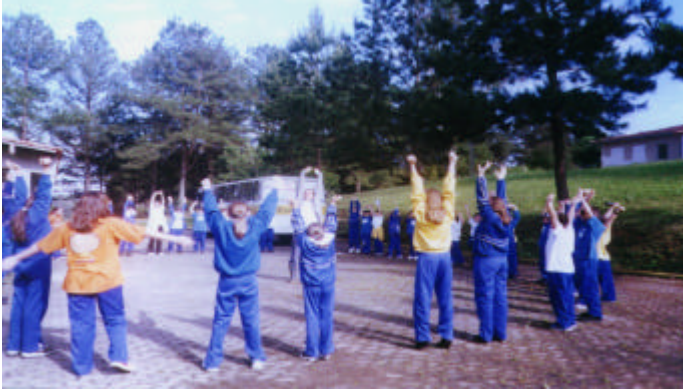
FIGURA 5. Relaxamento preparatório para atividades de educação ambiental em trilhas.

A ludicidade por ser um aspecto humano, está vinculada às emoções e, por isso, brincar ajuda no desenvolvimento da pessoa porque permite experimentar, criar e se expressar, contribuindo para a saúde física e emocional (Figura 5).