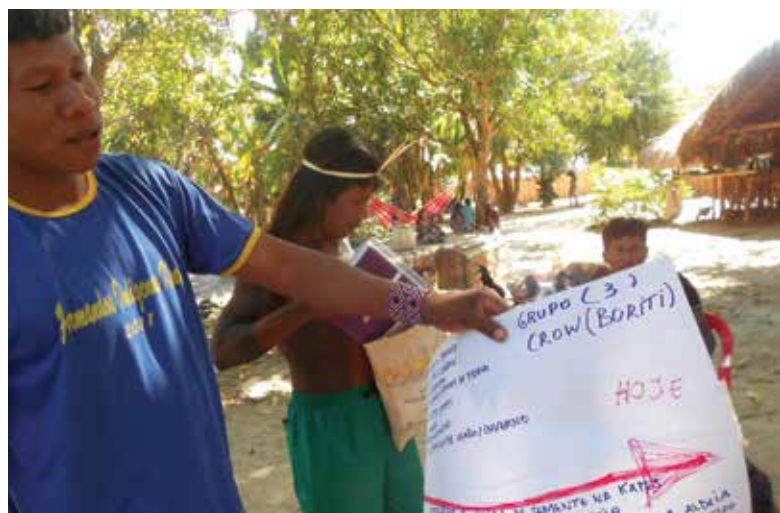
avaliação participativa das Feiras - Grupo Buriti

A própria realização da Feira de Sementes a cada três anos é muito mais um resultado do empenho militante dos técnicos e pesquisadores da Funai e da Embrapa envolvidos na