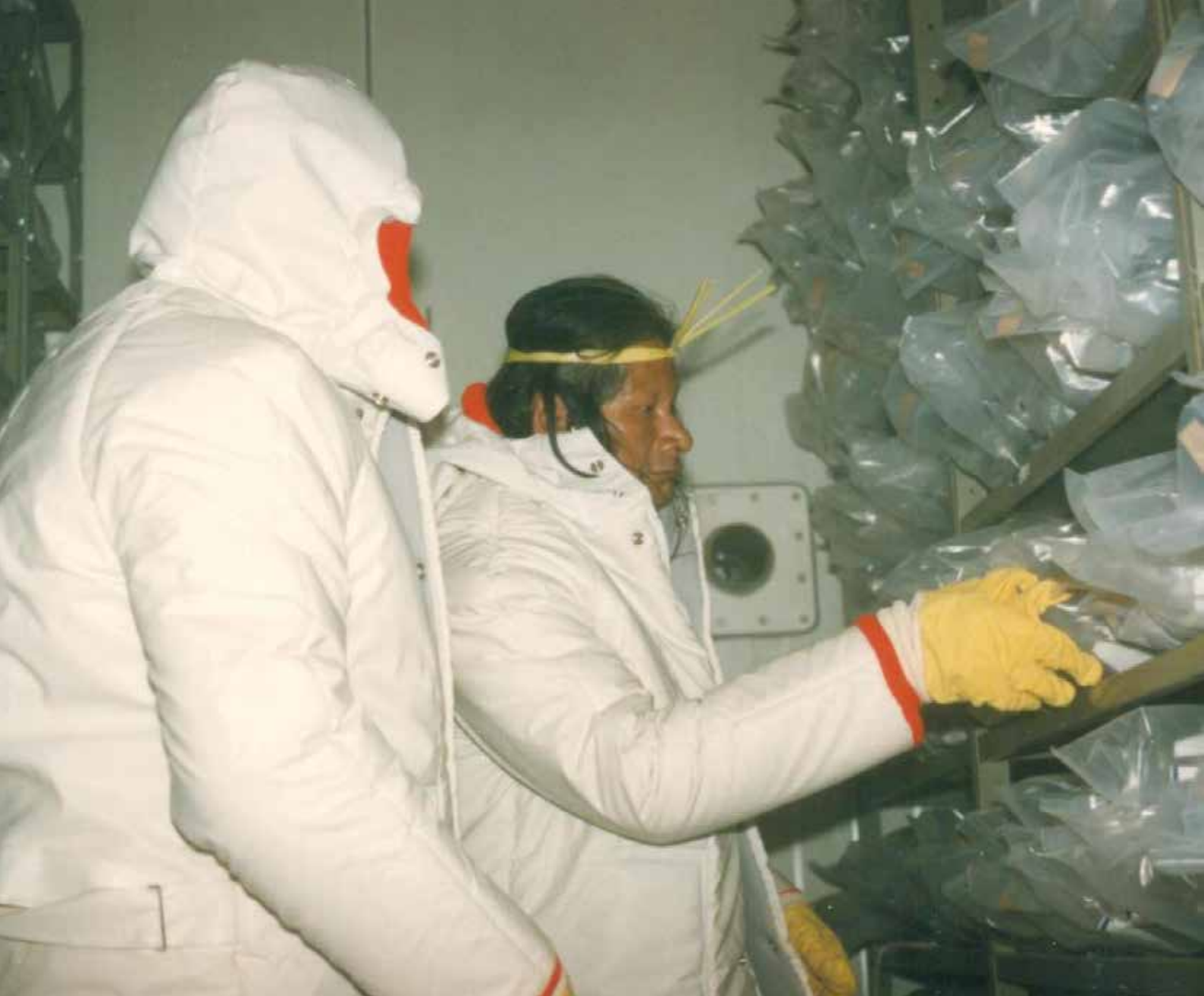
Cacique Krahô na Colbase da Embrapa Recursos Genéticos e Biotecnologia, em 1994

anos para que o milho pohumpéy restituído aos Krahô expressasse seu potencial genético e repovoasse as roças da Kraholândia 5 .