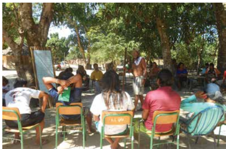
Reunião de avaliação e planejamento das feiras

De volta ao Tocantins, o milho foi cuidadosamente multiplicado em cada aldeia. Após mais de vinte anos congeladas – não só no sentido físico, mas sobretudo no sentido da sua evolução – as sementes não mostraram, num primeiro momento, grande adaptação ao meio de cultivo. Seriam necessários alguns