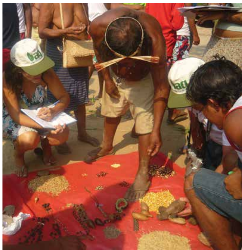
Premiação da Agrobiodiversidade Krahô

O relato do cacique Paresí Benedito Onizoka, do Mato Grosso do Sul, também ilustra a importância da Feira como espaço para o resgate de materiais: “É a primeira vez que