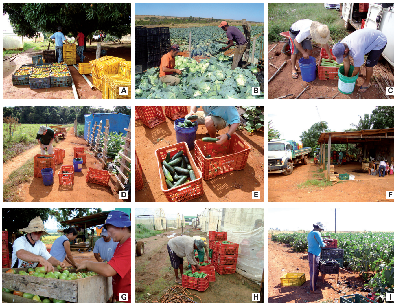
Figura 2 – Beneficiamento (seleção, limpeza, classificação e embalagem) de hortaliças em pequenas propriedades rurais do Distrito Federal