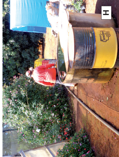
Figura 5 – Comparação entre os fluxos de trabalho descritos no texto, em duas propriedades rurais. Distrito Federal, 2014.