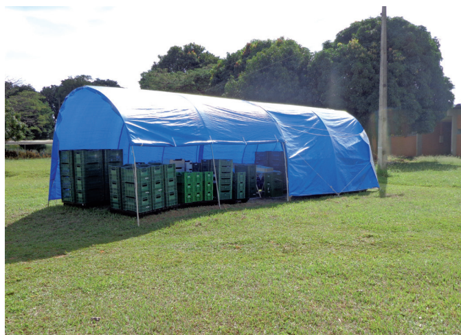
Figura 3 – Estação de trabalho - vista geral empregando lona branca ou azul