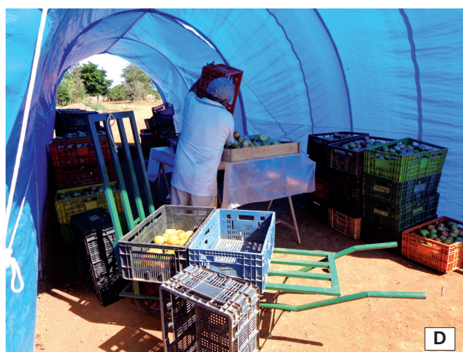
Figura 6 – Práticas a serem evitadas no manuseio das hortaliças.

Exemplos de posturas inadequadas observadas durante a validação dos equipamentos no Distrito Federal incluem: