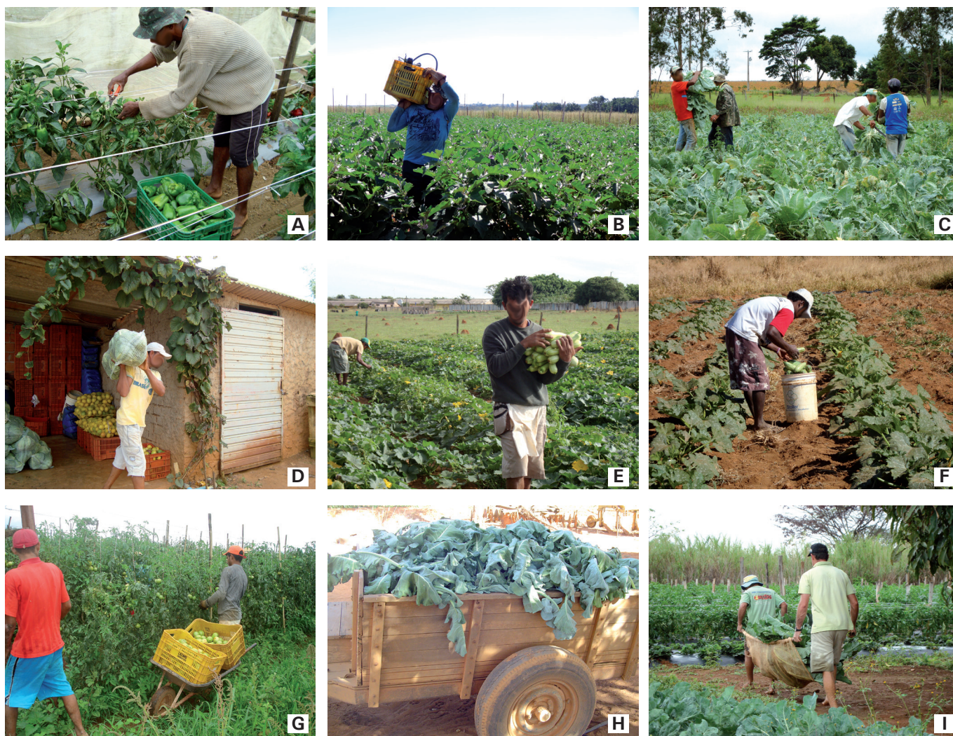
Figura 1 – Colheita e transporte de hortaliças em pequenas propriedades rurais do Distrito Federal.