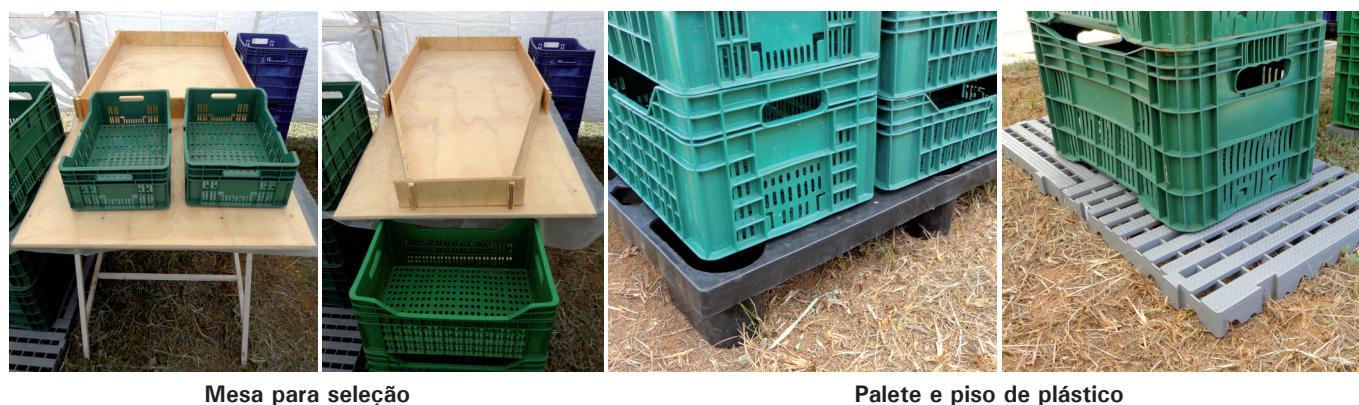
Mesa para seleção