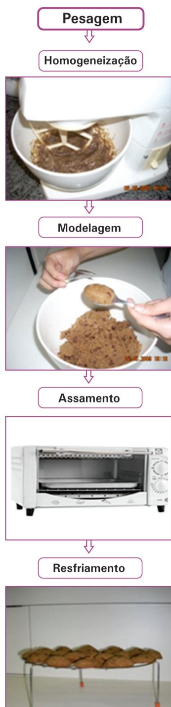
Figura 1. Fluxograma de processamento.

A elaboração dos biscoitos Controle, Teste I e Teste II, seguiu as etapas conforme fluxograma abaixo (Figura 1).