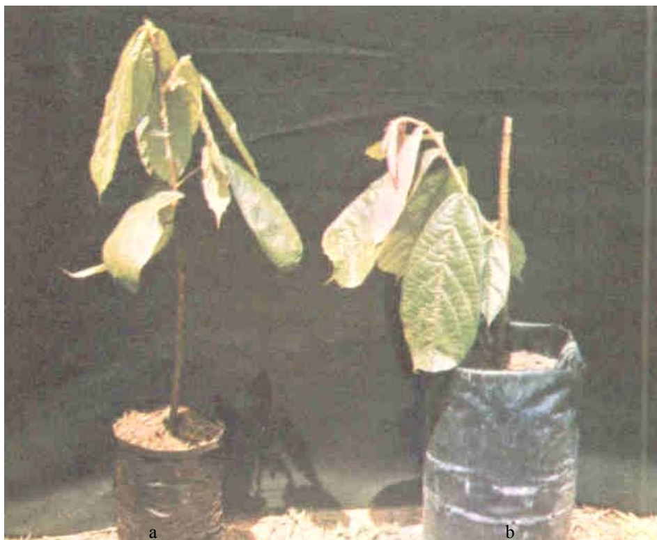
Fig. 3. a) Enxertia por garfagem do tipo de topo ou fenda cheia; b) enxertia por borbulhia do tipo forket ou placa ou escudo.