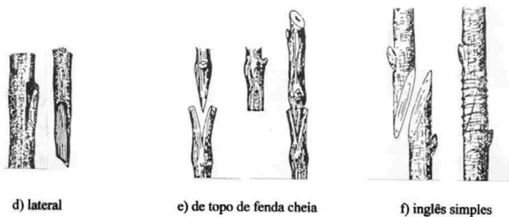
Fig. 1. Tipos e/ou métodos de enxertia. Fontes: a: Marranca, 1986; b, c, d, e, f: Calzavara, 1984.