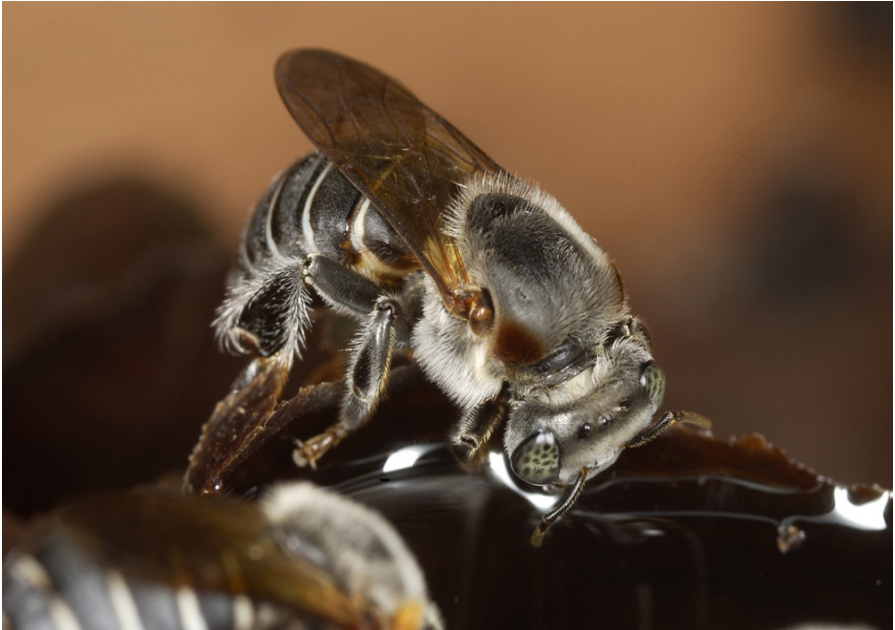
Figura 1. Operária de Melipona fasciculata Smith, 1854.

Uma segunda dieta foi avaliada, elaborada com os mesmos ingredientes da dieta utilizada por Costa e Venturieri (2009) (Anexo 1), mas com método de preparo diferente, que será descrito no item resultados.