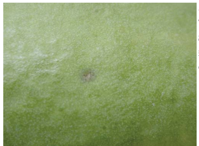
Fig. 2. Lesão nova de pinta preta com poucas pontuações de coloração marrom em frutos de mamoeiro.