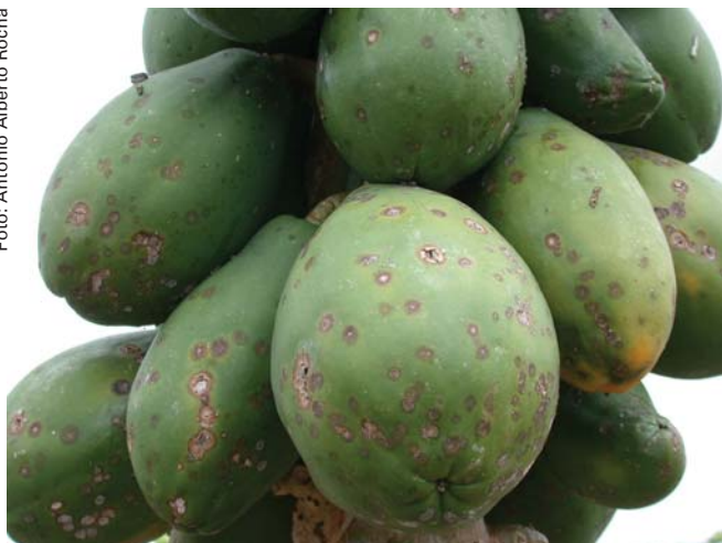
Fig. 3. Lesões de pinta preta em frutos de mamoeiro.

Pela alta frequência que ocorre e pelos danos que pode ocasionar ao mamoeiro, particularmente diminuindo o valor comercial dos frutos, a doença constitui um dos mais sérios problemas dessa fruteira (Bergamin Filho & Kimati, 1997; Oliveira et al., 2000). As medidas de controle recomendadas baseiam-se em práticas onerosas e algumas delas potencialmente agressivas ao meio ambiente, como é o caso da aplicação de fungicidas.