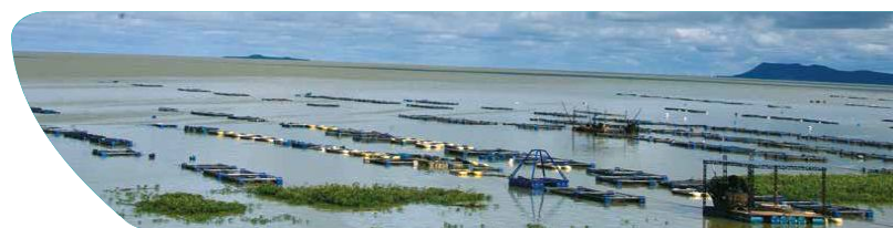
Foto. Área de produção de tilápia em tanques-rede no lago de Sobradinho (BA).