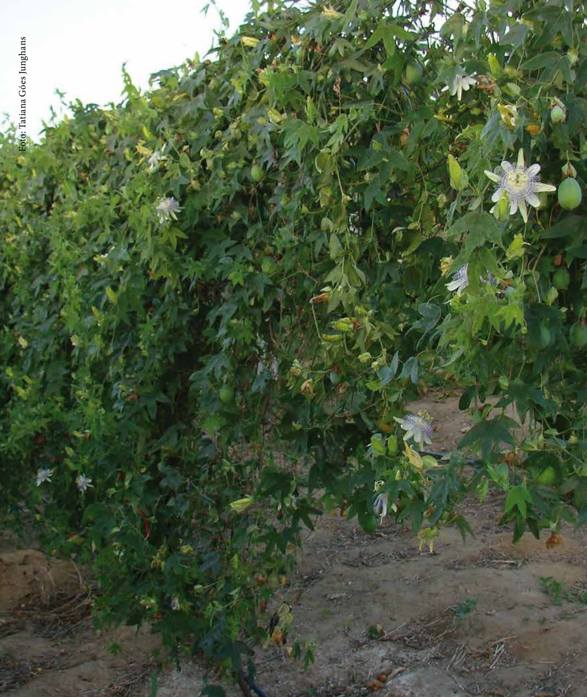
Figura 1. Passiflora gibertii : plantas em campo.