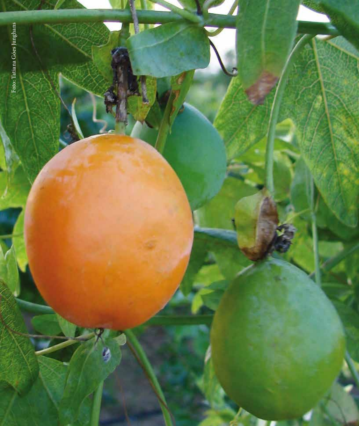
Figura 4. Passiflora gibertii : frutos na planta.