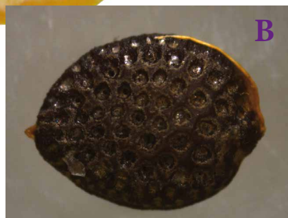
Figura 5. Passiflora gibertii : fruto cortado (A); semente (B).