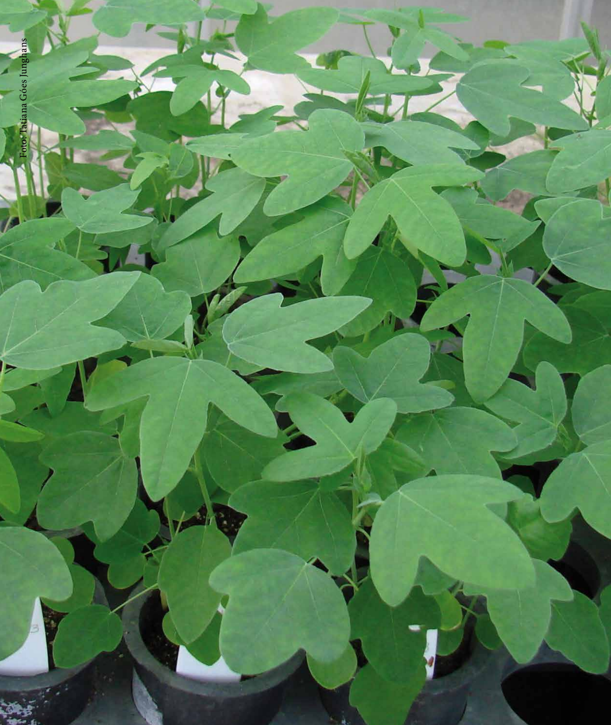
Figura 6. Plântulas de Passiflora gibertii aos 30 dias após a sementeira.