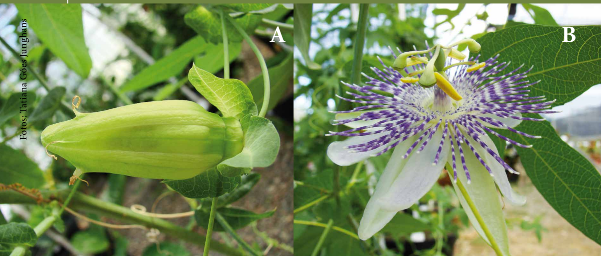
Figura 3. Passiflora gibertii : botão floral (A); flor (B).