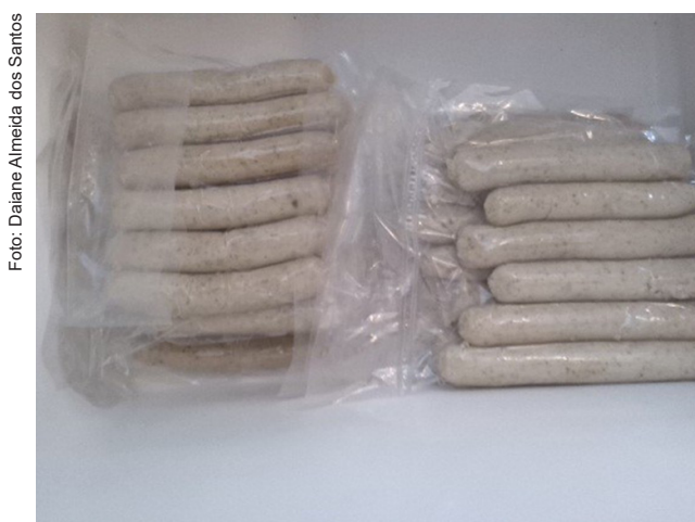
Figura 7. Salsichas prontas para o consumo.

Para o acondicionamento deve ser escolhida uma embalagem que forme uma barreira que promova segurança microbiológica ao produto. Imediatamente após o resfriamento, as tripas são removidas manualmente e o produto é acondicionado em sacos plásticos de filmes termoplásticos laminados com polietileno (Figura 7), selados a vácuo. As salsichas embaladas são armazenadas sob refrigeração de 2 a 8 °C.