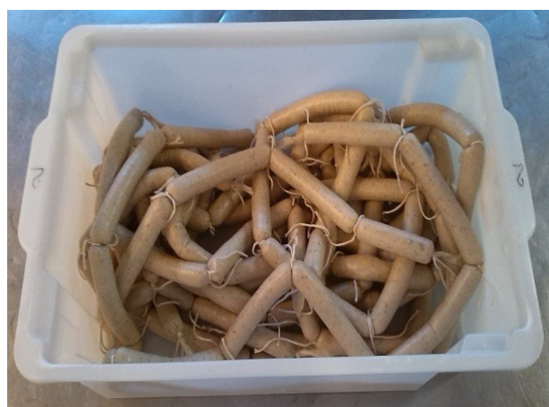
Figura 4. Passagem da massa pela embutidora de salsichas.