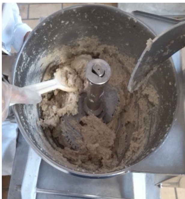
Figura 3. Mistura dos ingredientes no “cutter”.