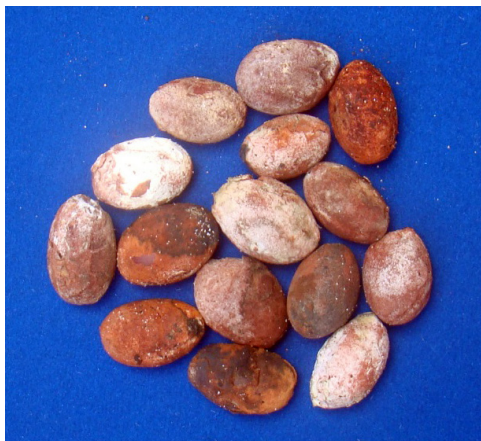
Figura 4. Sementes de jutaí-mirim após a retirada dos frutos.