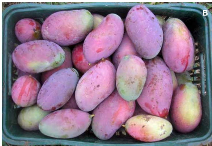
Figura 3. Mangueira da variedade Palmer em frutificação (A) e frutos colhidos (B), oriundos de sistema orgânico de produção na Chapada Diamantina, Lençóis, Bahia, 2018.