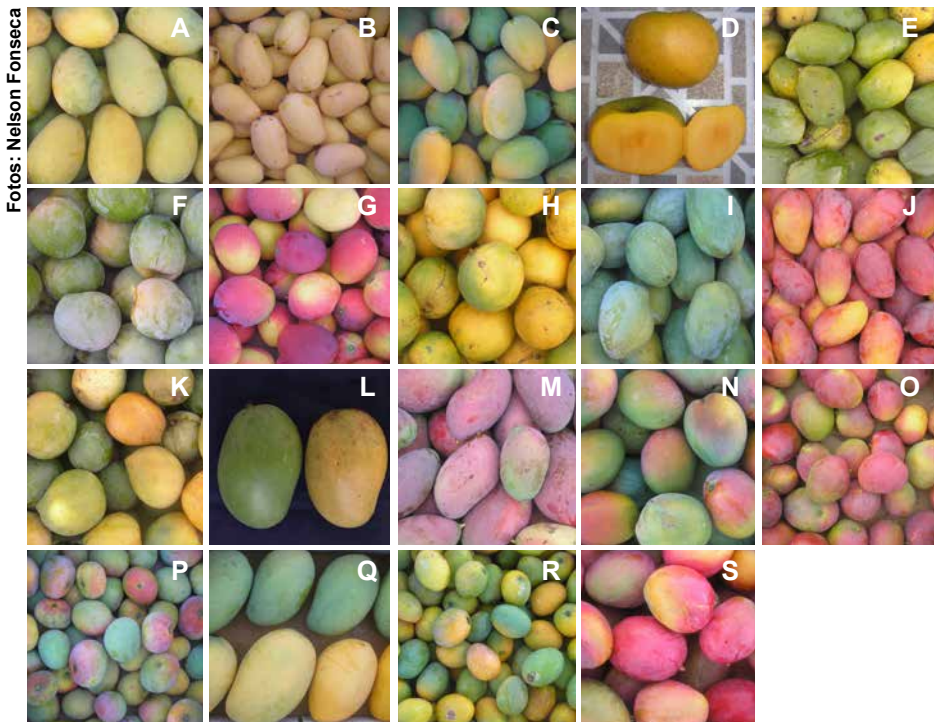
Figura 1. Variedades Anrapali (A), Ataulfo (B), Beta (C), Carlotão (D), Espada (E), Favo de Mel (F), Haden (G), Imperial (H), Itiúba (I), Joa (J), Juazeiro 2 (K), Mallika (L), Palmer (M), Papo de Peru (N), Roxa Embrapa 141 (O), Santa Alexandrina (P), Surpresa (Q), Ubá (R) e Tommy Atkins (S).

O ensaio experimental foi implantado em julho de 2011 com mudas enxertadas (porta-enxerto da variedade Espada), produzidas pela Embrapa Mandioca e Fruticultura. Foram utilizadas 19 variedades copas descritas a seguir: Anrapali, Ataulfo, Beta, Carlotão, Espada, Favo de Mel, Haden, Imperial, Itiúba, Joa, Juazeiro 2, Mallika, Palmer, Papo de Peru, Roxa Embrapa 141, Santa Alexandrina, Surpresa, Ubá e Tommy Atkins (Figura 1). O espaçamento entre plantas foi de 8m x 8m, constituindo-se de 156 plantas/ha.